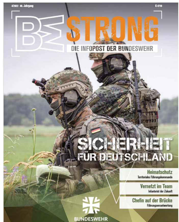
Cover der BE Strong.