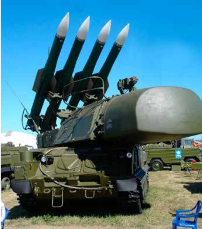
Ein Buk-System, mit dem die Boeing-Maschine MH-17 abgeschossen worden sein soll.

Kontrolle befunden habe: „Der US-Geheimdienst geht mittlerweile davon aus, dass pro-russische Separatisten den Flug MH17 aus Versehen abgeschossen haben.“ 30 Allerdings wurden hierfür erneut keine schlüssigen Beweise vorgelegt. Stattdessen antwortete einer der Geheimdienstler auf die Frage, was über diejenigen bekannt sei, die die Rakete abgefeuert hätten: „wir kennen keine Namen, wir kennen keinen Rang und wir sind nicht einmal 100% sicher, was deren Nationalität anbelangt.“ 31