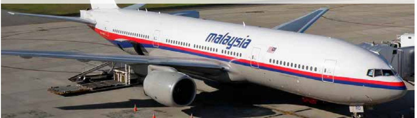
Die Boeing 777 der Malaysia Airlines, die später über der Ost-Ukraine abstürzte.

Die Frage, weshalb um alles in der Welt Russland eine Tat begehen sollte, die vollkommen vorhersehbar allein seinen Gegnern in die Karten spielen würde, wird überhaupt nicht gestellt. Dies und die Erfahrung, dass wohl nahezu jeder Krieg – insbesondere auch die des Westens in der jüngeren Vergangenheit – mit dreisten Lügenkonstrukten gerechtfertigt wurde, sollte eigentlich eine Warnung vor vorschnellen Vorverurteilungen sein. Was es nun bedarf ist eine genaue Untersuchung und nicht ein militaristisches Säbelrasseln, das genau in die Eskalation führen könnte, die sich viele im Westen scheinbar ohnehin herbeisehen.