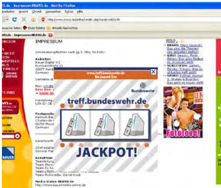
Bundeswehrwerbung im Rahmen des Online-Angebots der BRAVO