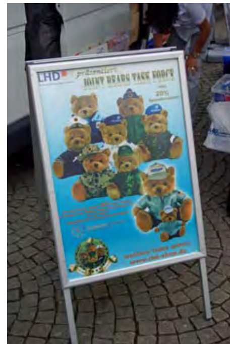
Teddybären als Rekrutierungshelfer

Das Zentrum für Nachwuchsgewinnung (ZNWG) setzt für das Messe- und Eventmarketing jedoch nicht nur einen Messestand, sondern auch einen Infotruck ein. Der Lastwagen hat – ähnlich dem „KarriereTreff“-LKW – einen begehbaren Auflieger, in dem Beratungen durchgeführt werden können und Broschüren ausliegen. Auch eines der acht Infomobile steht für den Einsatz auf Messen zur Verfügung.