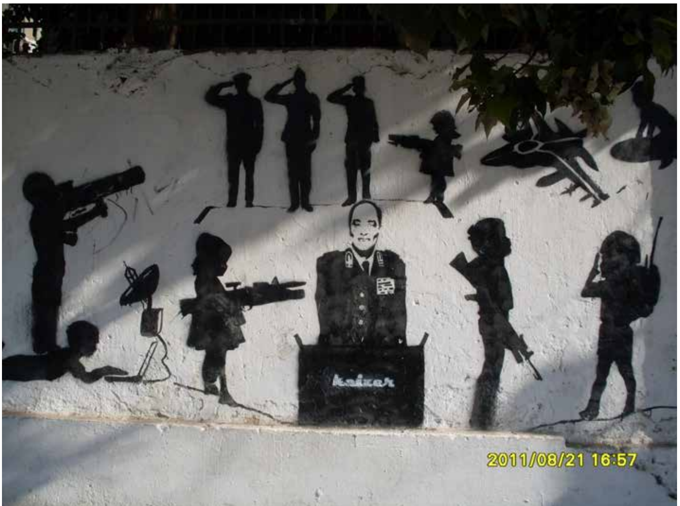
Militärkritisches Wandbild des ägyptischen Straßenkünstlers Keizer.