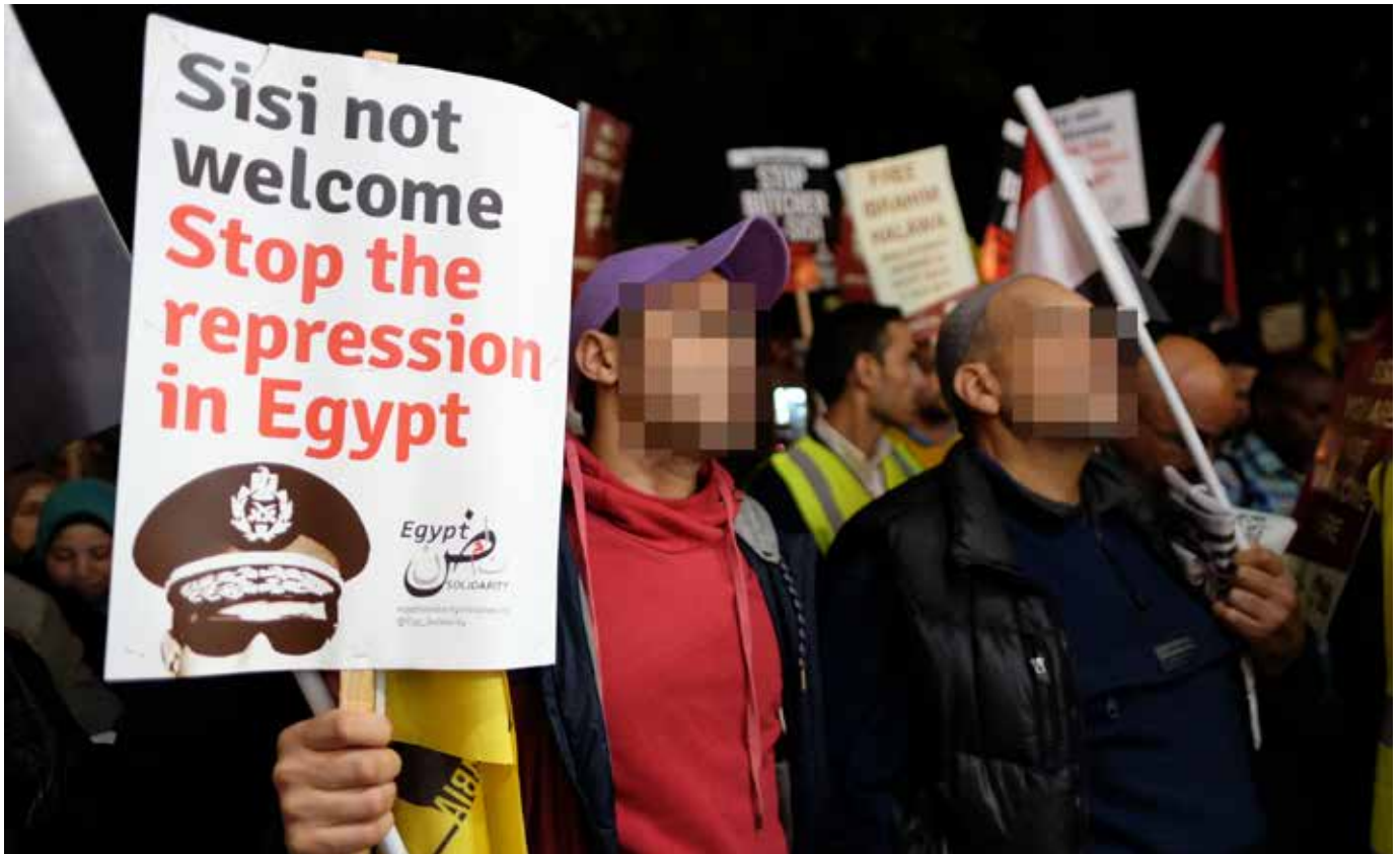
Protest in London gegen den Staatsbesuch Sisis Anfang November 2015.

tiert werden. 56 Mitte August 2016 veröffentlichten ägyptische Gewerkschaftler_innen aus unterschiedlichen Sektoren einen Aufruf zur internationalen Solidarität für eine Kampagne, die sich um die Freilassung von 26 inhaftierten Werftarbeitern der Alexandria Shipyard Company bemüht. Die Arbeiter wurden im Rahmen eines Streiks für bessere Arbeitsbedingungen am 24. Mai 2016 festgenommen und warten seither auf das Urteil eines Militärgerichts. Das 1960 gegründete, staatliche Alexandria Shipyard Unternehmen wurde im Jahr 2007 von dem dem Verteidigungsministerium unterstehenden Marine Industries and Services Organization übernommen 57 . Seither sind die Arbeiter_innen laut dem Aufruf der Gewerkschaften dem Militärrecht unterstellt, obwohl sie als zivile Arbeiter_innen zu betrachten seien. Die Unterzeichner_innen des Aufrufs appellieren, in Protestbriefen bzw. -mails an den Präsidenten Abdel Fattah al Sisi und an den ägyptischen Arbeitsminister die unverzügliche Freilassung der Arbeiter_innen des Unternehmens Alexandria Shipyard zu fordern.