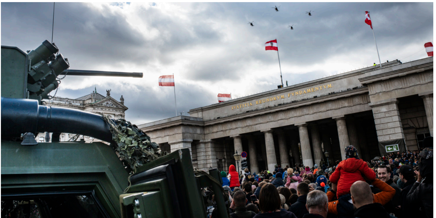
Leistungsschau am Nationalfeiertag.

Bei dem inoffiziellen EU-Gipfel auf Zypern vom 23. bis 24. April 2026, mit Gästen wie dem Jihadisten Al Scharaa und dem Autokraten Al-Sissi, haben die Regierungschefs die EU-Kommission, mit expliziter Bestätigung der neutralen Staaten, beauftragt eine Operationalisierungs-Blaupause bis Juni 2026 vorzulegen (red ORF).