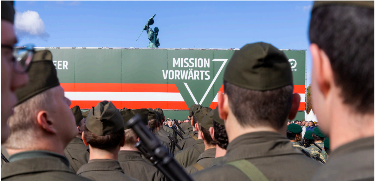
Nationalfeiertag 2025 und Festakt 70 Jahre Bundesheer.

Der Aufbauplan 2032+ stellt also eine gegenwärtig im Trend liegende Aufrüstung dar – nur dass Österreich nun Mal von der neutralen Schweiz und Liechtenstein und sonst von NATO-Ländern umgeben ist – für welches Szenario hier aufgerüstet wird, bleibt fraglich. Außerdem möchte die österreichische Regierung die nationale Rüstungsindustrie stärken und sie mit der „Industriestrategie 2035“ fördern. Dies soll auch dadurch geschehen, dass die nationale Rüstungsindustrie leichter exportieren kann, also eine gesetzliche Vereinfachung mit der „nicht-tödliche Rüstungsgüter leichter ins Ausland verkauft werden können – wie dies im Einklang mit Österreichs Neutralität gelingen soll, untersuche man“ (Profil 2026).