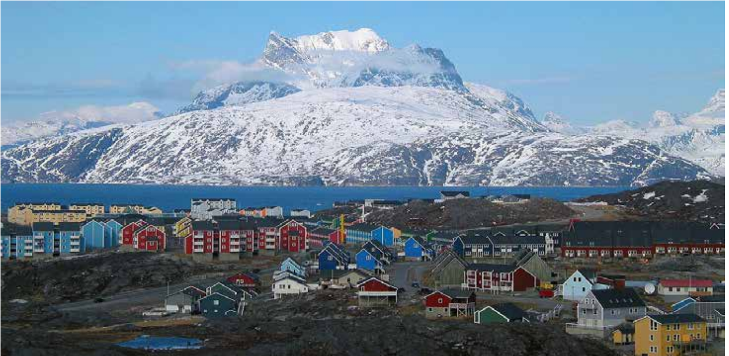
Nuuk in Grönland.