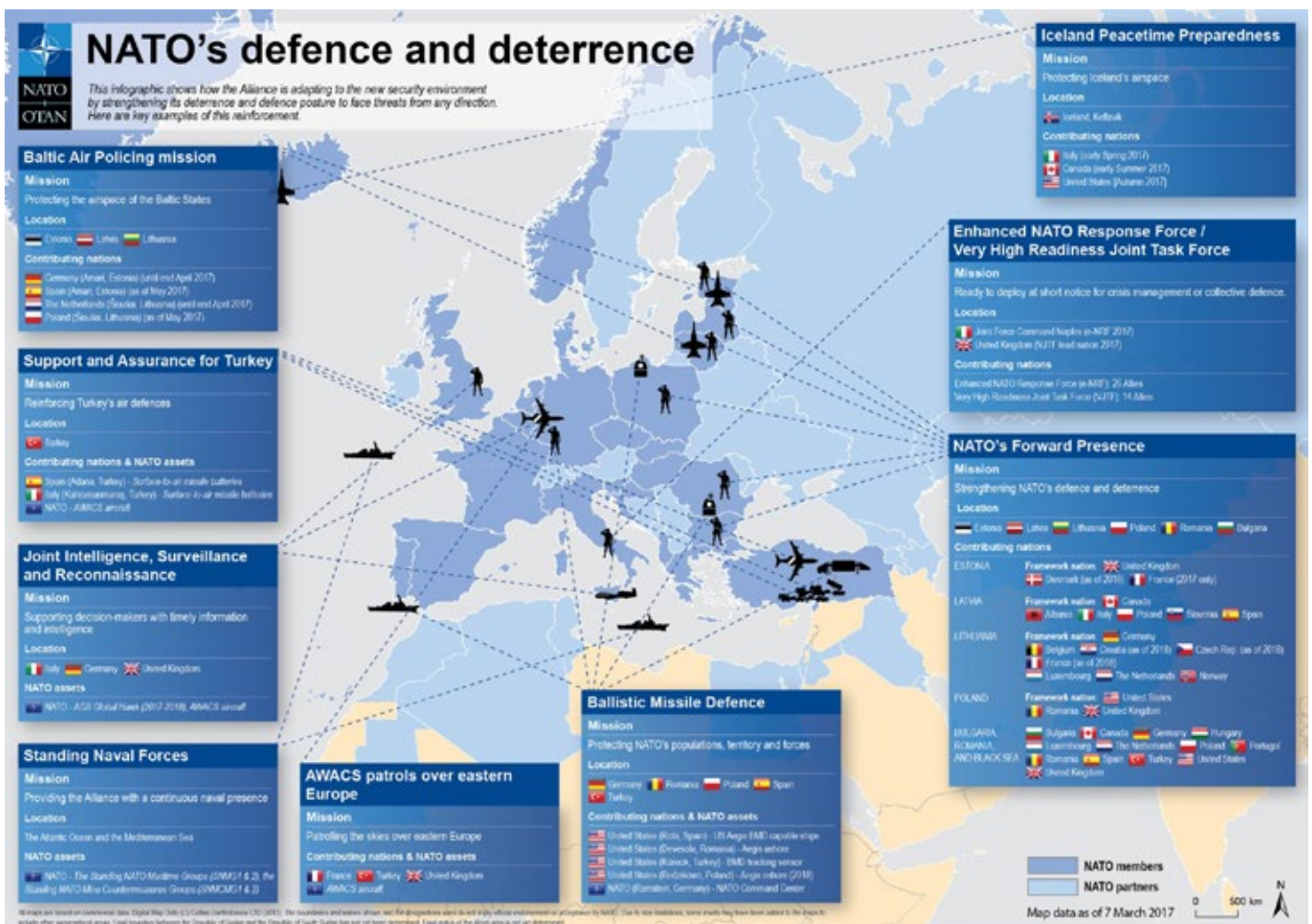
NATO-Militärpräsenz in Osteuropa 2017.

Vor allem aber fordert Russland, die ständige NATO-Truppenpräsenz auf den Stand der NATO-Russland-Akte von 1997 zurückzuführen. Diese völkerrechtliche Absichtserklärung wurde damals vereinbart, um russische Bedenken gegenüber der sich anbahnenden ersten NATO-Osterweiterung abzumildern, wozu insbesondere folgende Stelle dienen sollte: „Die NATO wiederholt, dass das Bündnis in dem gegenwärtigen und vorhersehbaren Sicherheitsumfeld seine kollektive Verteidigung und