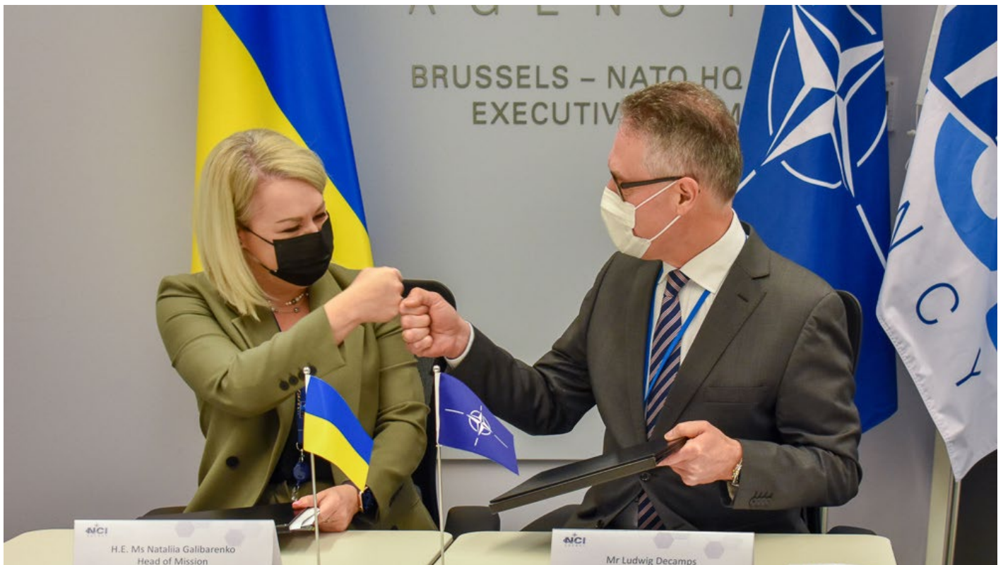
Die ukrainische NATO-Botschafterin Nataliia Galibarenko und der NATO-Beamte Ludwig Decamps, bei einem Treffen, auf dem eine engere Kooperation im Technologiebereich vereinbart wurde.

Ohne es mit letzter Sicherheit wissen zu können macht es vor diesem Hintergrund einigen Sinn, den russischen Truppenaufmarsch als eine klare Drohung in Richtung der ukrainischen