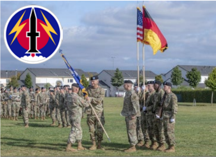
Das Foto stammt von der Indienststellung der "Multi Domain Task Force" in Wiesbaden am 16. September 2021. Links oben ist das Logo des 56. Artilleriekommandos zu sehen. Rechts die Struktur einer MDTF. Rot markiert sind die drei Kurz- und Mittelstreckensysteme.