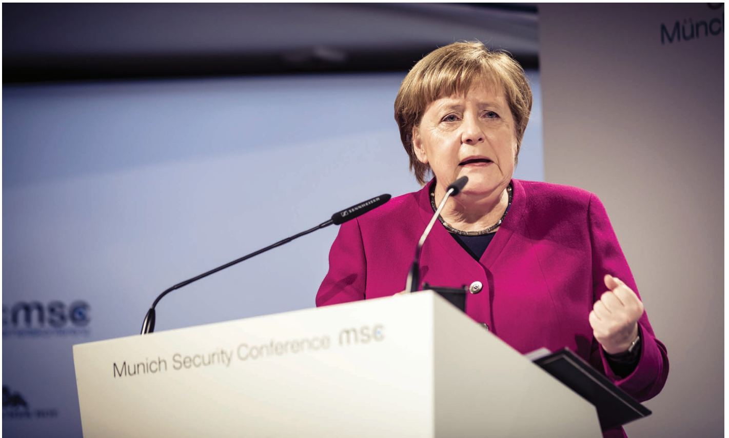
Rede von Angela Merkel.

kanisch-europäischen Verhältnis kommen könnte – zumal eine Wiederwahl von US-Präsident Donald Trump, dem Epizentrum der aktuellen transatlantischen Konflikte, derzeit keineswegs ausgeschlossen erscheint.