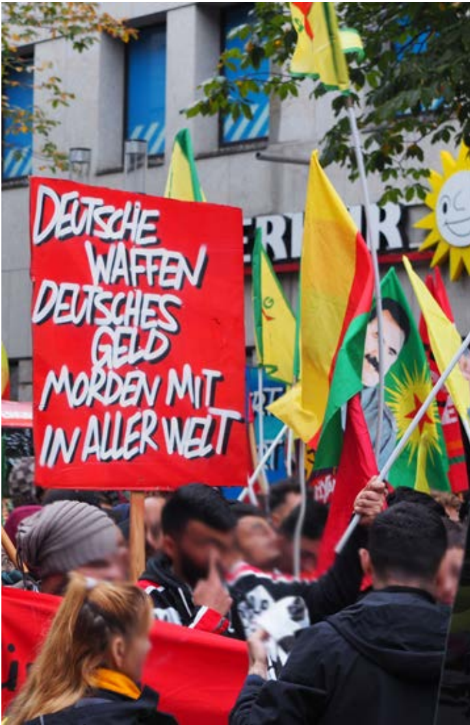
Antikriegsdemo in Stuttgart.

genaue Ausgestaltung der Zone hänge jedoch von Gesprächen mit Russland und der Türkei ab, die beide ausdrücklich einbezogen werden sollen. Die Antwort auf die Frage, wie genau eine solche Zone unter Einbeziehung der Türkei, die bereits positiv auf den Vorstoß reagiert habe, aussehen soll, bleibt die Verteidigungsministerin schuldig. Am 23. Oktober 2019 sagte sie, die rechtliche Grundlage für den möglichen Einsatz solle ein UNO-Sicherheitsmandat sein.