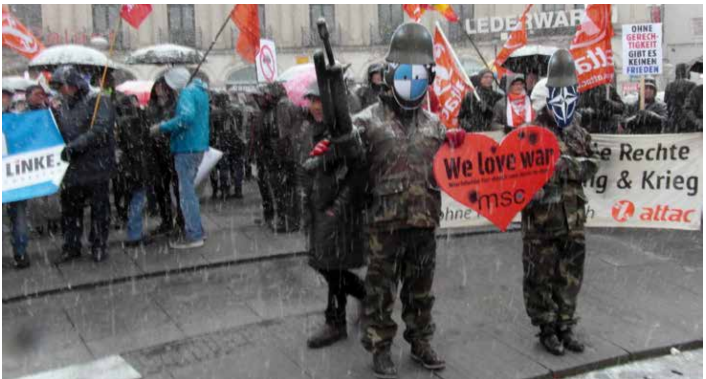
Anti-SiKo-Proteste 2018.