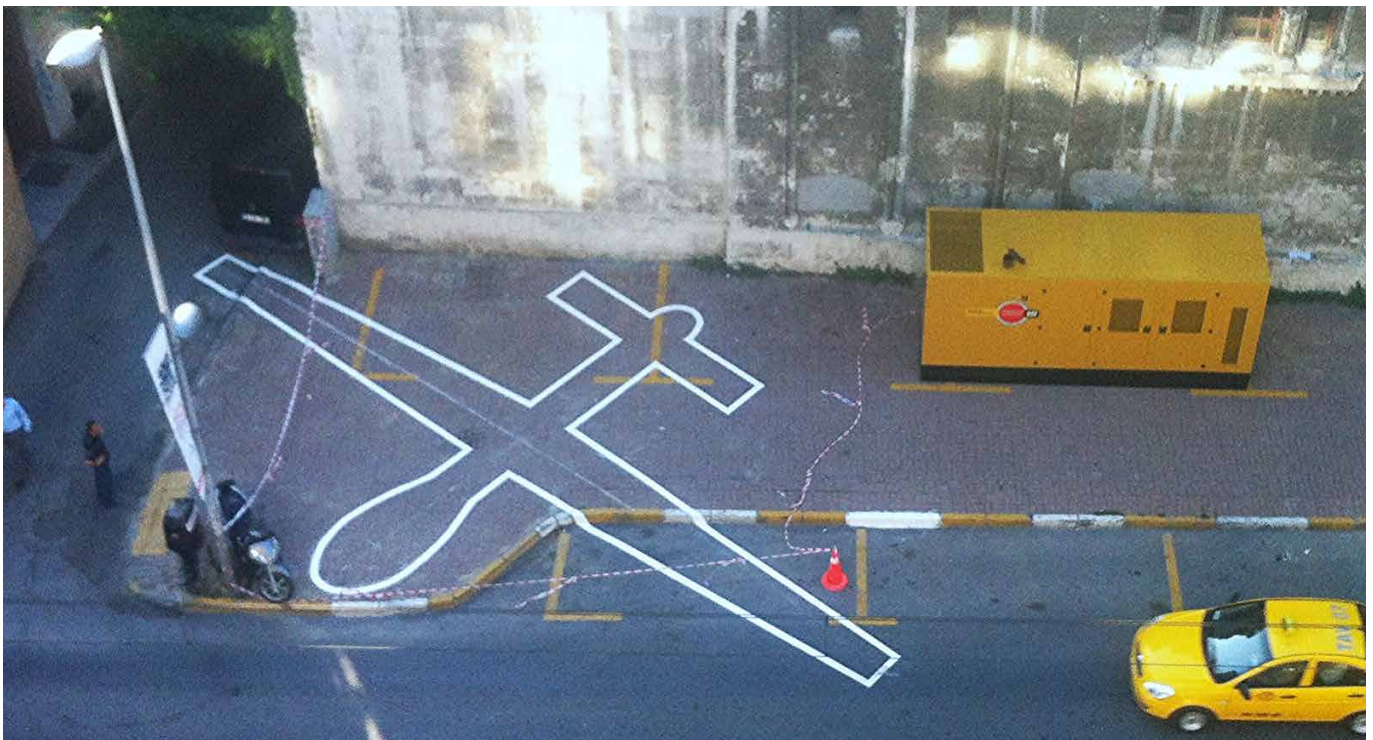
Ein früheres Werk von James Bridle, Drone Shadow 002, in Istanbul im Jahr 2012.

Dass die SPD jetzt schon laut über eine Zustimmung nachdenkt und überwiegend leicht erfüllbare