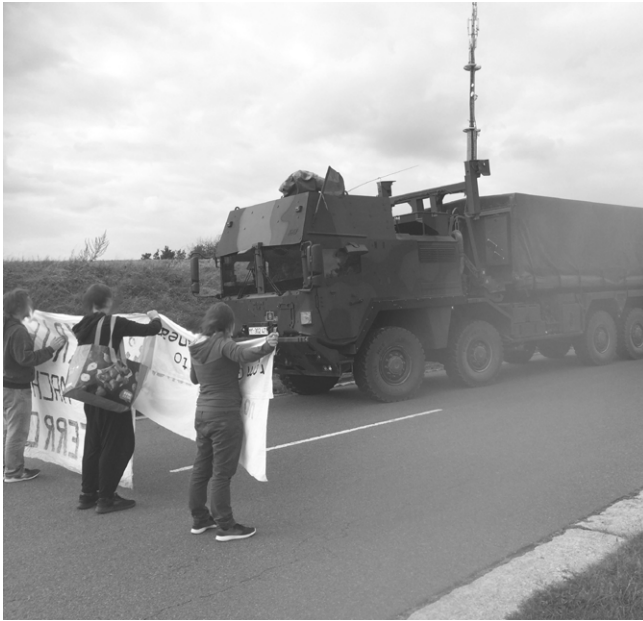
Blockade einer Logistikübung der Bundeswehr in Hardheim im Jahr 2017.

keitsbereich. Im Kriegsfall wäre er für die Versorgung der Kampftruppen und zugleich für die militärische Absicherung des Bundesgebietes zuständig.