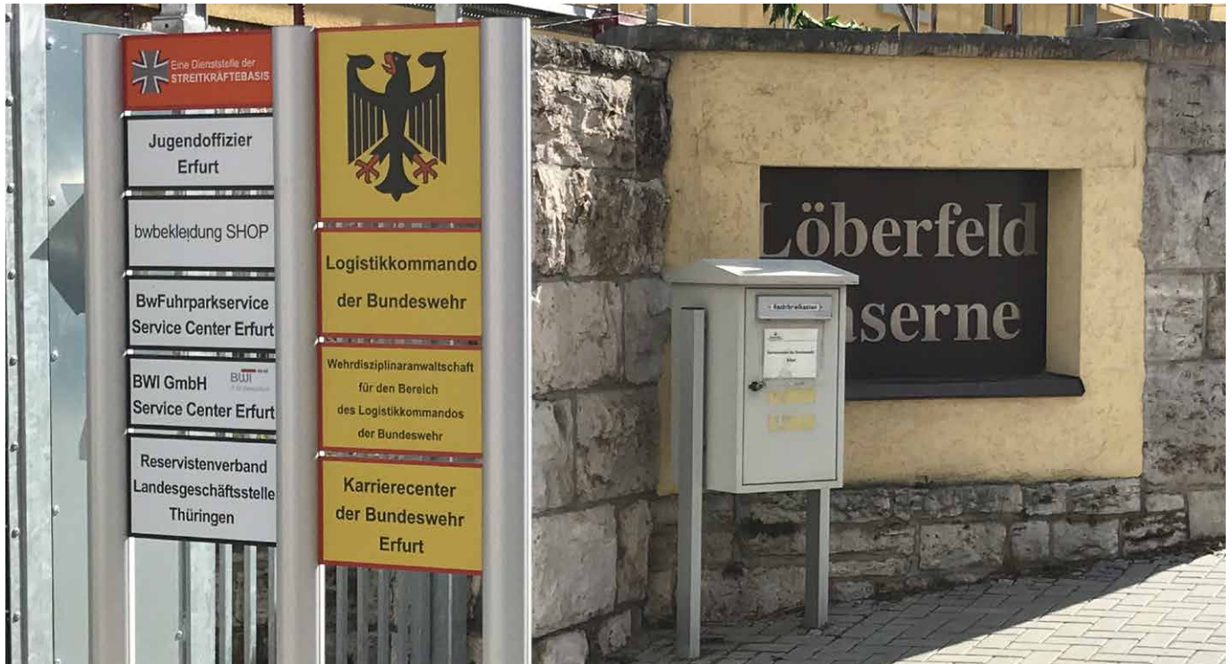
Eingang der Löberfeld-Kaserne in Erfurt, wo sich unter anderem das Logistikkommando der Bundeswehr befindet.

Rast- und Ruheräumen oder an Einschiffungs- und Entladestellen“ 2 bereitgehalten. Zudem baut die Bundeswehr eben diese Fähigkeiten im Verbund mit NATO und EU aktuell weiter aus. Deutschland und die Bundeswehr treten aber nicht nur als Host Nation für andere Partnerstaaten auf. Regelmäßig nimmt die Bundeswehr die beschriebenen Unterstützungsleistungen auch selbst in Anspruch. Beispiele dafür sind der Ausbildungsaufenthalt von Pilot*innen der Luftwaffe in den USA, die Teilnahme der Bundeswehr an Übungen und Manövern in ganz Europa, der Material- und Personaltransport für die Versorgung der Auslandseinsätze, oder die jährliche Rotation des von Deutschland geführten NATO-Bataillons in Litauen. Host Nation Support in Deutschland beschränkt sich nicht ausschließlich auf Bündnispartner. „Grundsätzlich kann jede ausländische Streitkraft, die nach Deutschland kommen möchte, Host Nation Support beantragen“, 3 heißt es auf der Website der Bundeswehr. Ein Beispiel dafür: Im Juli 2019 übten Bundeswehr und Chinesische Volksbefreiungsarmee im bayerischen Feldkirchen für gemeinsame Einsätze unter dem Dach der Vereinten Nationen. 4 In solchen Fällen werden für jeden Aufenthalt eigene Verträge aufgesetzt, die Rechte und Pflichten der Vertragspartner regeln.