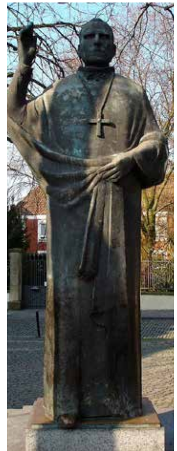
Statue von Bischof Clemens August Graf von Galen am nordöstlichen Ende des Domplatzes in Münster. Bischof Galen verkündete in seinem Hirtenbrief 1943: „Nach der Lehre des hl. Thomas von Aquin steht der Soldatentod in treuer Pflichterfüllung an Wert und Würde ganz nahe dem Martertod für den Glauben. ... Darum wird den christlichen Soldaten, die im Gehorsam gegen Gott aus Liebe zum Vaterland ihr Leben hingeben, ewige Herrlichkeit und Lohn zuteil werden, ganz ähnlich wie den hl. Märtyrern.“