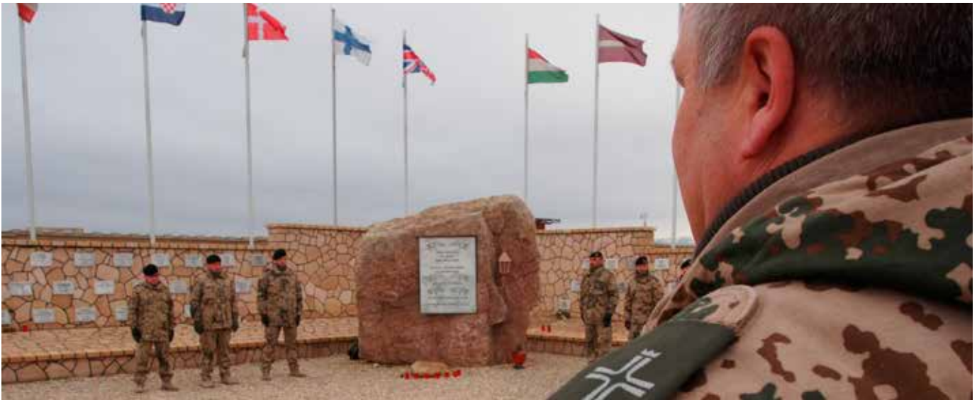
Ein katholischer Militärgeistlicher vor dem Ehrenhain für die Soldat*innen im Camp Marmal in Masar-i-Scharif.