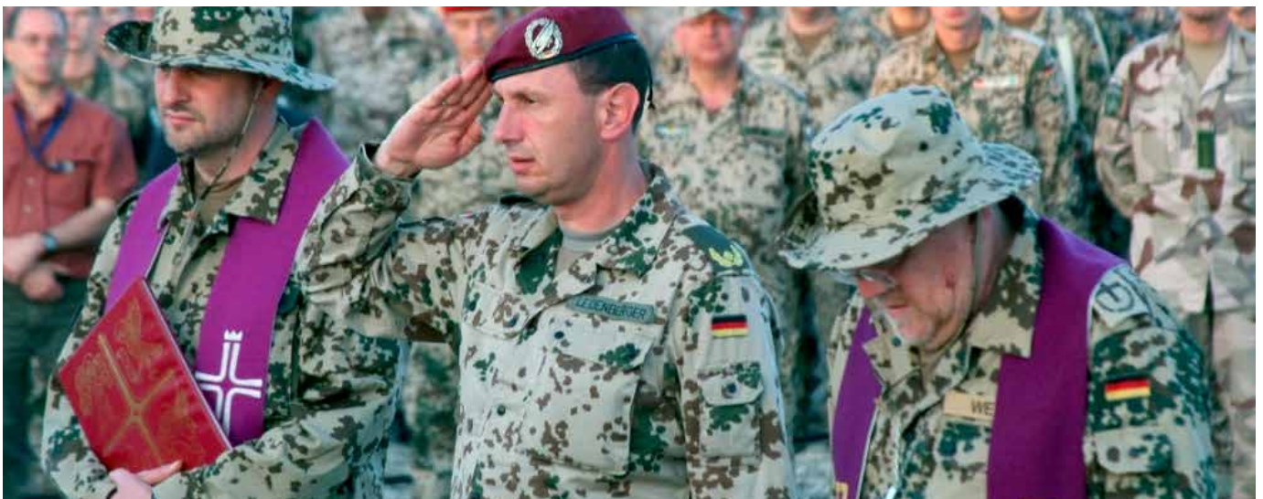
Militärpfarrer bei der Andacht.

Wie bei den Aufgaben der Militärseelsorger*innen ange-