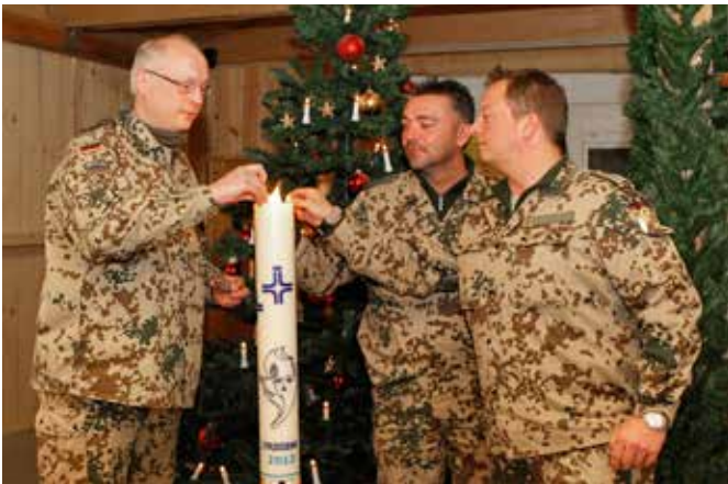
Das Team der Katholischen Militärseelsorge in Kunduz grüßt mit der Weltfriedenstagskerze aus der sanierten „Gottesburg“ zusammen mit einem Soldaten vom Dezernat der BauInfra „alle Kamerad(innen) in den Einsätzen und in der Heimat“.

Somit ist das Argument nicht stichhaltig genug, um daraus die Präsenz von Militärseelsorger*innen in deutschen Kasernen abzuleiten, da auch nach Dienstschluss noch genug Möglichkeiten bestehen, kirchliche Einrichtungen zu besuchen oder Gespräche zu führen.