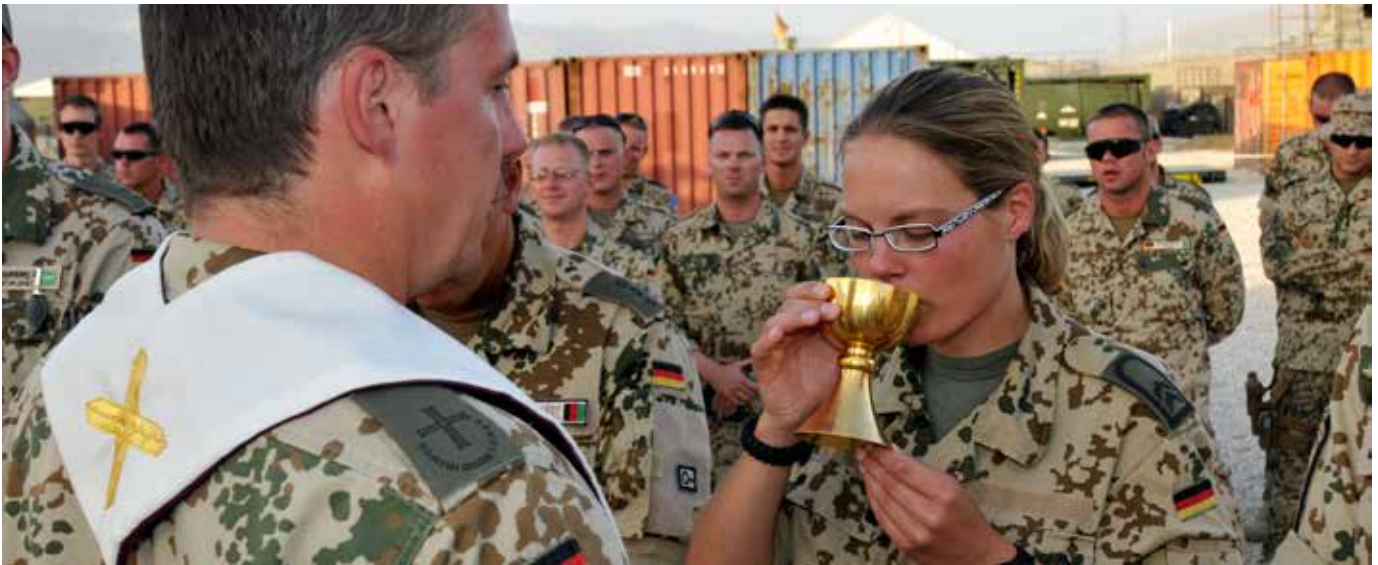
Empfang der Kommunion.

es in der Bundeswehr insgesamt 264.000 Soldat*innen katholischen und evangelischen Glaubens geben. Das allein ergibt schon einen Überschuss der Militärggeistlichen von 40%. Berücksichtigt werden muss noch, dass natürlich nicht alle aktiven Soldat*innen der evangelischen oder katholischen Kirche angehören. Somit wird die Prozentzahl noch deutlich höher ausfallen. In diesem Zusammenhang muss noch eine Anmerkung über die Zahl der Soldat*innen über den Zeitverlauf hinweg gemacht werden. Im Juli 2011 wurde die Wehrpflicht außer Kraft gesetzt. Die Zahl der aktiven Soldat*innen war bis 2011 relativ konstant bei ca. 215.000 Soldat*innen, danach waren es nur noch ungefähr 180.000 Soldat*innen. Die Zahl der Militärseelsorger*innen hat sich im Laufe der Zeit nicht signifikant verändert.