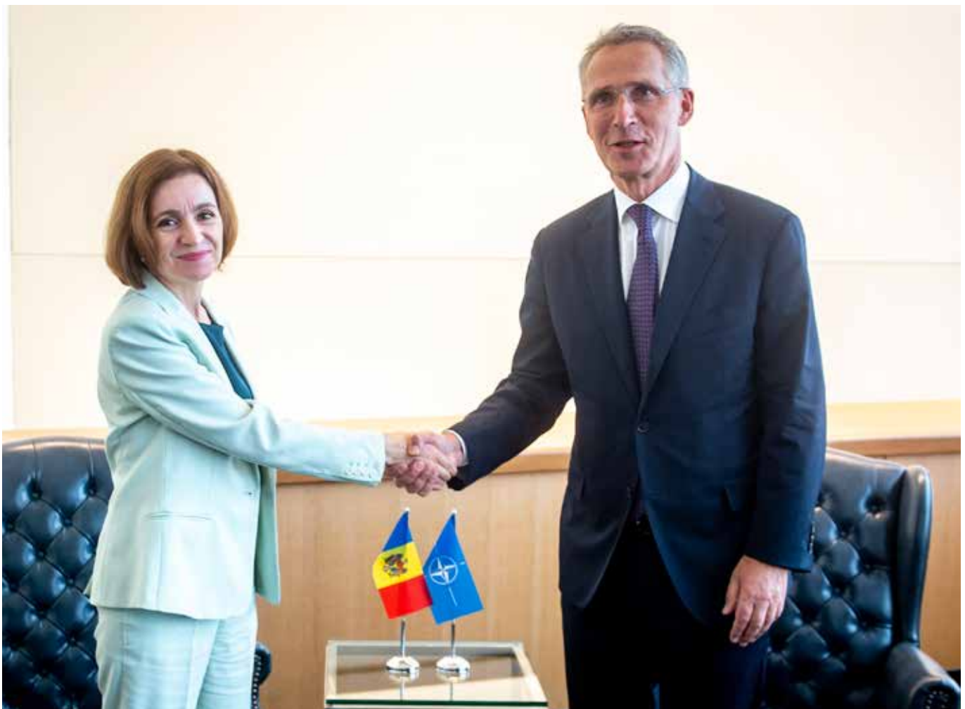
NATO-Generalsekretär Stoltenberg trifft sich mit der Präsidentin Moldaus, Sandu, im September 2022.

In ihrer Verfassung hat die Republik Moldau die eigene Neutralität festgehalten 11 – an der eigenen Verfassung festzuhalten, scheint allerdings keine Stärke dieses Staates zu sein, könnten böse Zungen behaupten. Zwar ist Moldau formal (noch) kein Teil eines militärischen Bündnisses, bereits seit 1992, also nur einem Jahr nach der Staatsgründung, unterhält man allerdings Beziehungen zur NATO. Zu Beginn waren sie zwar im Rahmen des NATO-Kooperationsrates zu sehen, der als Forum für Verständigung zwischen der NATO und ehemaligen Staaten (eher: deren Nachfolgestaaten) des Warschauer Pakts dienen sollte, 12 allerdings wurde hier bereits der Grundstein für zukünftige Zusammenarbeit gelegt. Mittlerweile hat man in Moldau die Kooperation mit der NATO weitläufig ausgebaut, so hat die NATO beispielsweise eine ständige Vertretung in der moldauischen Hauptstadt Chişinău. Auch an militärischen Operationen nimmt das moldauische Militär teil, es stellt beispielsweise ca. 40 Soldat*innen für den Einsatz der NATO in Kosovo. 13 Natürlich ist diese geringe Anzahl an Soldat*innen nicht ausschlaggebend für den Erfolg der Mission, vielmehr handelt es sich um Symbolpolitik – es entsteht der Eindruck, Moldau wolle dem Westen seine Treue beweisen.