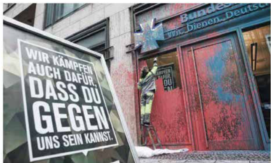
Kontroversen machen das Bild bunt| die Bundeswehr stellt sich der Debatte.

...ten sich getragen von denjenigen Menschen, deren „Recht und Freiheit“ kaputt zu verteidigen sie geschworen haben, im äußersten Fall sogar unter Einsatz ihres Lebens. In diesem Verständnis fördert die Bundeswehr auch den sicherheitspolitischen Diskurs in unserem Land, etwa durch ihre Jugendoffiziere. Denn es braucht einen steten Austausch über die Bundeswehr und ihre Aufgaben: so umfassend und so ernsthaft wie möglich – und so kontrovers wie nötig.