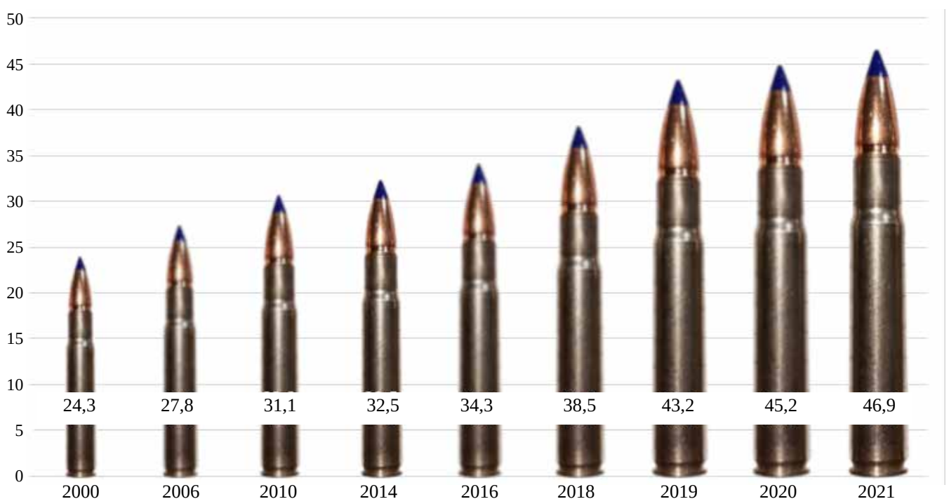
Rüstungshaushalt 2000-2021 in Milliardenbeträgen, inkl. Corona-Hilfen

Insgesamt kann man davon ausgehen, dass das Konjunkturprogramm eine zusätzliche Finanzspritze für den Militärhaushalt darstellt. Und um hier einfach noch einmal den Zusammenhang herzustellen: Die Bundesregierung schlug für 2021 einen offiziellen Militärhaushalt von 45,6 Mrd. Euro vor (ohne NATO-Kriterien, die noch einmal höher liegen), plus 1,2 Mrd. Euro aus dem Corona-Paket (nach der letzten Bereinigungssitzung stieg der Gesamtbetrag sogar auf 46,93 Mrd. Euro). Dabei werden die Gelder aus dem Konjunkturpaket nicht etwa im Einzelplan 14 (Verteidigungshaushalt), sondern im Einzelplan 60 (Allgemeiner Haushalt) verbucht, also dort, wo sich in Zukunft auch der deutsche Anteil zum Europäischen Verteidigungsfonds finden lassen wird. Das sind gewaltige Steigerungen des Bundeswehrhaushaltes von offiziell 24,3 Mrd. Euro (2000) über 31,1 Mrd. Euro (2010) und 32,5 Mrd. (2014) bis hin zu den heutigen Summen. Dazu muss man wissen,