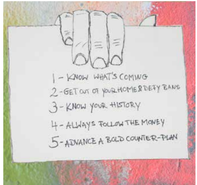
Naomi Kleins Fünf-Punkte-Plan.

Es gibt auch gute Nachrichten: Zum einen betont Naomi Klein in ihrem letzten Kapitel der Schockstrategie, dass ein Schock ein temporärer Zustand sei, sich abnutze und Schockresistenz entwickelt werden kann. Zum zweiten entwarf sie im Jahr 2017 einen Fünf-Punkte-Plan 6 gegen die Schockstrategie des damaligen US-Präsidenten Donald Trump. Obwohl der Plan auf den US-amerikanischen Kontext vor der Covid19-Pandemie ausgerichtet ist, bleibt er global wertvoll und aufschlussreich. Zunächst wichtig, laut Klein: zu wissen, was passieren wird! Bei der Betrachtung zurückliegender Katastrophen und Krisen zeige sich, dass wahrscheinlich ein Ausnahmezustand ausgerufen und Protest kriminalisiert wird. Wenn wir uns dessen