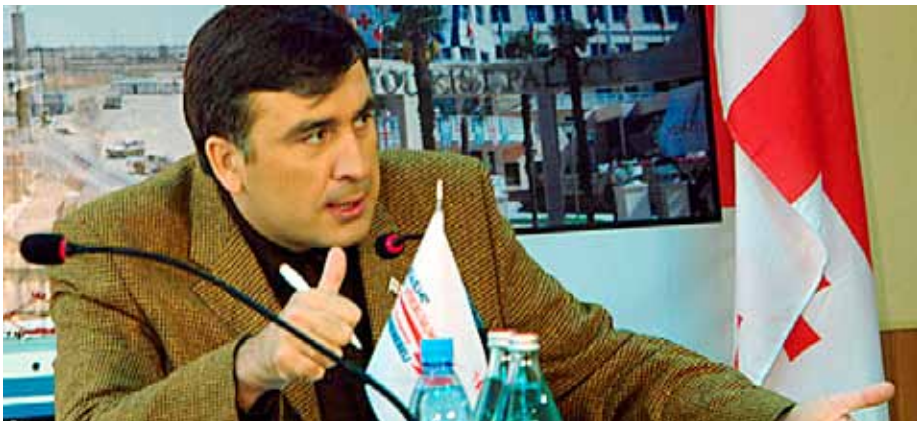
Georgischer Präsident Saakaschwili

größten geopolitischen Erfolge für die US-Ambitionen, Russlands Einfluss in der Region zurückzudrängen. Möglicherweise wollte Russland, das selbst mit einer eigenen Pipeline eine Alternativroute unter seiner Kontrolle bereithält, die Verlässlichkeit Georgiens als künftiges Transitland für kaspische Energieträger nachhaltig erschüttern. Medienberichten zufolge sieht dies die georgische Seite zumindest so: „Der georgische Sicherheitsberater Lomaia sagt, die Russen hätten sechs Bomben auf die Pipeline abgeworfen, sie aber nicht getroffen. Sollte das zutreffen, wäre dies ein Hinweis, dass Russlands Militäraktion auch andere, viel weiter reichende strategische Ziele verfolgt als nur, eine humanitäre Krise in Südossetien zu verhindern.“ 9