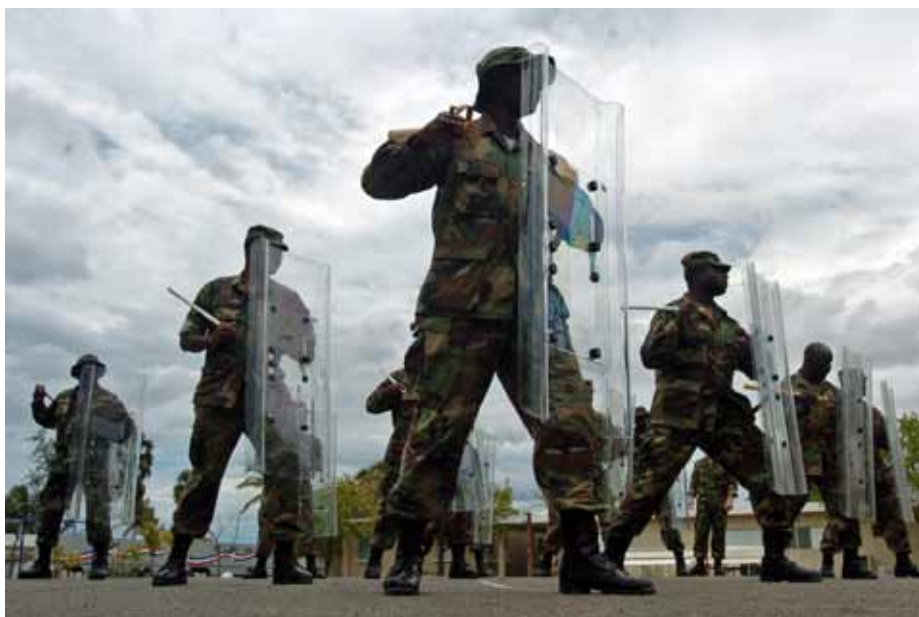
Riot-Controll in der Dominikanischen Republik während der Tradewinds-Übung 2008

Die Merida Initiative ist ein Abkommen zwischen Mexiko, den zentralamerikanischen Staaten und den USA, das Mittel zur militärischen und polizeilichen Aufrüstung enthält, die offiziell der Bekämpfung des Drogenhandels, transnationaler Kriminalität und illegale Migration dienen soll. Für das Abkommen beantragte die US-Regierung 550 Mio. US$ im Nachtragshaushalt für 2008, der Kongress genehmigte 450 Mio., wovon 400 an Mexiko und 50 Mio. an die Länder Zentralamerikas gingen. Für 2009 hat die Regierung erneut 550 Mio. beantragt, der Kongress hat bisher nicht