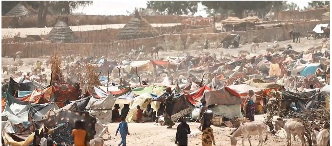
Flüchtlingscamp im Tschad.

Als die sudanesische Bevölkerung Ende 2018 dann gegen den Diktator al-Bashir aufbegehrte, führten die beiden einen Putsch gegen diesen an und setzten ihn fest. Doch dass deren neue Regierung kein Interesse an einer Einführung der Demokratie und einer partizipativen Politik hatte, wurde spätestens klar, als sie ein Protestcamp für die Einsetzung einer zivilen Regierung vor dem Hauptquartier des Militärs mit scharfer Munition beschossen und dabei über 140 Menschen töteten und etliche entführten und vergewaltigten. 2023 entzweite ein innerer Machtkampf um die Integration der RSF in das Militär al-Burhan und Dagalo und seitdem bekämpfen sie sich blutigst auf dem Rücken der Bevölkerung.