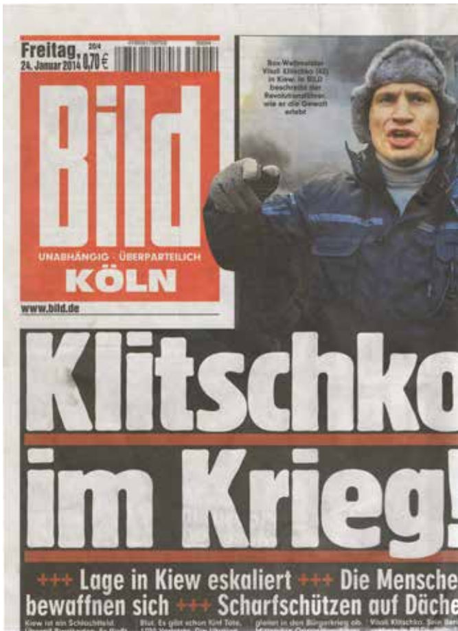
Die Bild-Zeitung (24.1.2014) mit ihrer Sicht auf die Ereignisse in der Ukraine.

Grand Strategy“: „Osteuropa ist das Tor zwischen den riesigen Ressourcen Asiens und den dichtbesiedelten und technisch fortgeschrittenen Bevölkerungen Europas. Das bedeutet, dass es entweder vom imperialen Despotismus Russlands oder der demokratischen Zivilisation Europas kontrolliert werden wird. Aufgrund seiner geographischen Lage wird derjenige, der den Zugang zu dieser wesentlichen Zone gewinnen wird, auch Einfluss über den gesamten eurasischen Superkontinent erhalten. Sollte Osteuropa von Moskau kontrolliert werden, werden die Europäer – und darüber auch die Nord-Amerikaner – Gefangene sein, wie sie es die meiste Zeit des Kalten Krieges waren. Sollte Osteuropa von Brüssel (und ebenso von London, Paris und Berlin) – und darüber auch von Washington – geformt werden, wird Russland geschwächt und relativ harmlos zurückgelassen, so wie es die meiste Zeit in den 1990ern und 2000ern war.“ 56