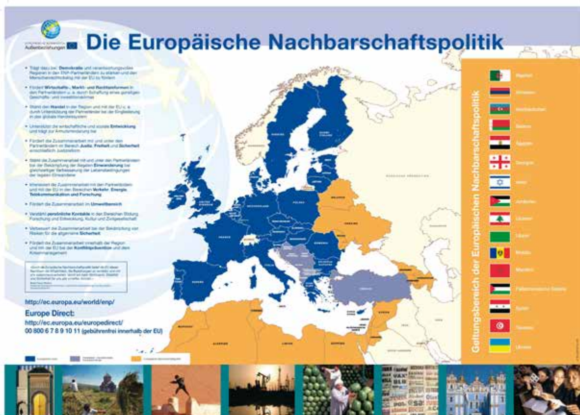
Die Nachbarschaftspolitik aus EU-Sicht.

Und tatsächlich hat sich unter den neuen Mitgliedsländern ob ihrer begrenzten Einflussmöglichkeiten inzwischen Ernüchterung breit gemacht. 15 Doch auch wenn die Strategie der EU-Großmächte so besehen von Erfolg gekrönt war, war sie gleichzeitig auch nicht reproduzierbar. Denn eine neuerliche Erweiterungsrunde, insbesondere um bevölkerungsreiche Staaten, man denke hier etwa an die Türkei mit ihren aktuell über 76 Mio. Einwohnern, würde die in harten Verhandlungen mühsam durchgesetzte Machtverschiebung zugunsten der EU-Großmächte wieder konterkarieren, weshalb dies zu keinem Zeitpunkt ernsthaft zur Debatte stand. 16 Gleichzeitig herrschte aber auch Einigkeit darüber, dass das europäische Expansionsprojekt hiermit noch nicht an sein Ende gekommen sein sollte: „Schon vor dem Vollzug der Osterweiterung 2004 setzten in der EU-Kommission Überlegungen ein, wie es danach weitergehen sollte. [...] Die EU war an die Grenzen ihrer bisherigen Entwicklungsdynamik, der wechselseitigen Bestärkung von Integration und Erweiterung, gelangt. [...] Klar war aber auch, daß ein abruptes Ende der Expansionsdynamik nicht im Interesse der EU sein konnte, da es die Gefahr implizierte, die EU in einen schroffen Interessengegensatz zu ihrer Peripherie zu bringen. Es mußte also darum gehen, ein Konzept zu entwickeln, welches eine weitere Expansion der EU zuläßt, ohne daß diese Expansion die EU zu weiteren Erweiterungen zwingt. Wie ist Expansion ohne Erweiterung möglich?“ 17