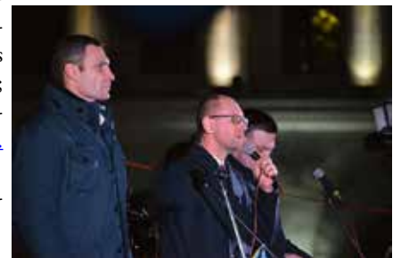
Klitschko (Udar), Jatsenjuk (Batkiwschtschina) und der Swoboda-Anführer Tjagnibok bei den Maidan-Protesten.

Vor diesem erschreckenden Hintergrund ist der ungewöhnlich scharfen Kritik des ehemaligen EU-Erweiterungskommissars Günter Verheugen nur zuzustimmen: „Was die jetzige Situation so schwierig macht und auch das Gespräch [mit Russland] so schwierig macht, hat ja eine Ursache auch in Kiew selber, nämlich die Tatsache, dass dort ein fataler Tabubruch begangen worden ist, dem wir auch noch applaudieren, der Tabubruch nämlich, zum ersten Mal in diesem Jahrhundert völkische Ideologen, richtige Faschisten in eine Regierung zu lassen, und das ist ein Schritt zu weit.“ ( Deutschlandfunk , 18.03.2014)