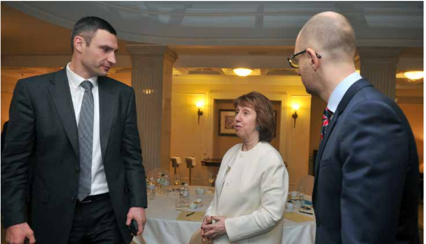
Die EU-Außenbeauftragte Catherine Ashton mit den (damaligen) ukrainischen Oppositionellen Witali Klitschko (Udar) und Arseniy Yatsenyuk (Batkiwschtschina).