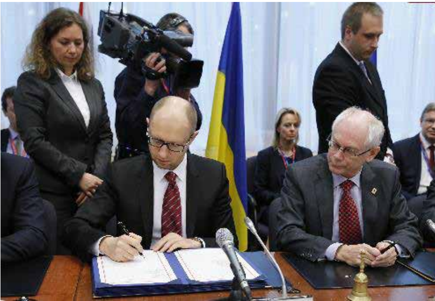
Unterzeichnung des Assoziationsabkommens zwischen der Ukraine und der EU Ende März 2014.

dings auf erbitterten Widerstand stieß (siehe auch Kasten: Braune Revolution). So wird eine Borotba-Aktivistin folgendermaßen zitiert: „Zu Beginn der Maidan-Proteste haben einige Mitglieder unserer Gruppe versucht, dort auch soziale Themen anzusprechen. [ ] Unsere Leute waren dort mit Gewerkschaften unterwegs und verteilten Flugblätter, aber dann rief der Redner auf der Hauptbühne dazu auf, den Infostand anzugreifen, mehrere unserer Mitglieder wurden zusammengeschlagen, das Zelt zerstört. Danach haben wir nicht mehr versucht, uns an den Maidan-Protesten zu beteiligen. [ ] Später haben dann die liberalen und rechten Parteien die Proteste unter ihre Kontrolle gebracht, wenn man mitmachen wollte, musste man sich deren Zielen unterordnen. Sie wollten offensichtlich eine Eskalation herbeiführen. Angesichts dieser Entwicklung haben wir dann begonnen, stattdessen Antikriegskundgebungen zu organisieren.“ 78