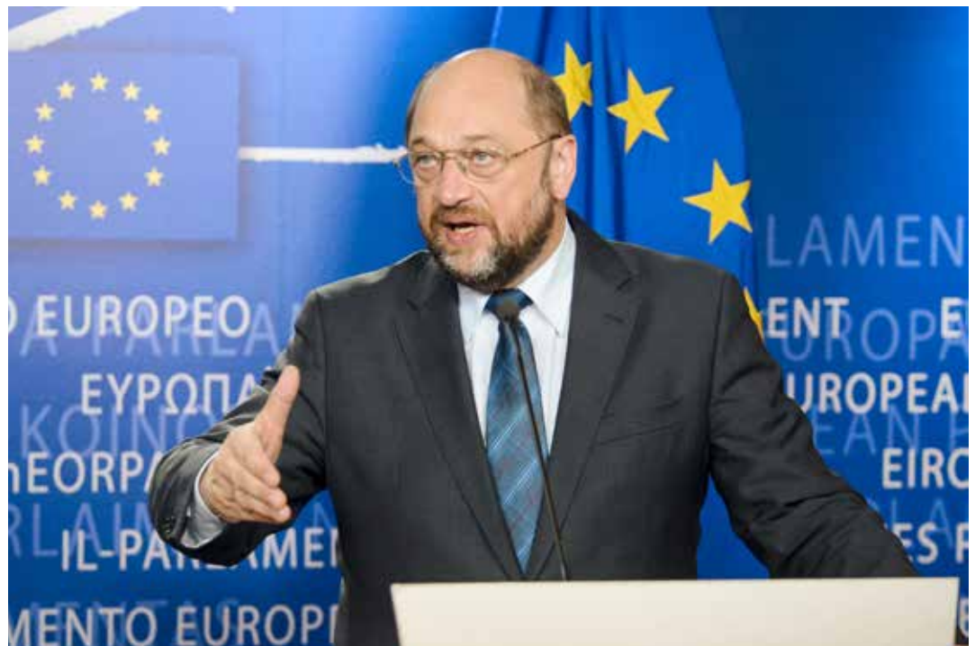
Vorkämpfer der „Weltmacht Europa“: Martin Schulz.