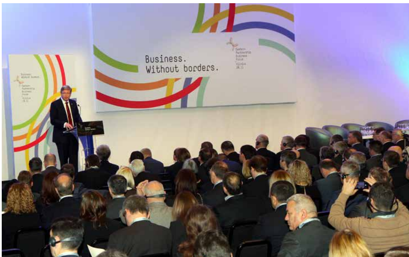
EU-Erweiterungskommissar Štefan Füle beim Gipfeltreffen der Östlichen Partnerschaft Ende November 2013.

Geht man diese Punkte der Reihe nach durch, so stößt man zunächst auf das Kernanliegen: „Die Vertragsparteien errichten während einer Übergangszeit von höchstens zehn Jahren [...] schrittweise eine Freihandelszone.“ (Titel IV, Artikel 25) Für die Umsetzung dieses Zieles müssen unter anderem Zölle, mit denen ein Land zum Schutz seiner Wirtschaft Waren eines anderen Landes verteuern kann, nahezu komplett abgeschafft werden: „Jede Vertragspartei senkt oder beseitigt Zölle auf Ursprungswaren der anderen Vertragspartei im Einklang mit den Stufenplänen in Anhang I-A dieses Abkommens (im Folgenden ‚Stufenpläne‘).“ (Titel IV, Artikel 29, Absatz 1) Wer den hochgradig irritierenden Versuch unternimmt, nachzuvollziehen, was sich hinter Anhang I-A verbirgt, sieht sich mit einer etwa 1500 Seiten langen Liste konfrontiert, in der Details zu den künftigen Zöllen für nahezu jedes erdenkliche Produkt festgelegt werden. Dankenswerterweise hat die Europäische Kommission selbst hier zur Klärung beigetragen, indem sie in einem Hintergrundpapier verdeutlichte, durch das Assoziationsabkommen würden die Zölle um 99,1% (Ukraine) bzw. 98,1% (EU) abgesenkt. 35