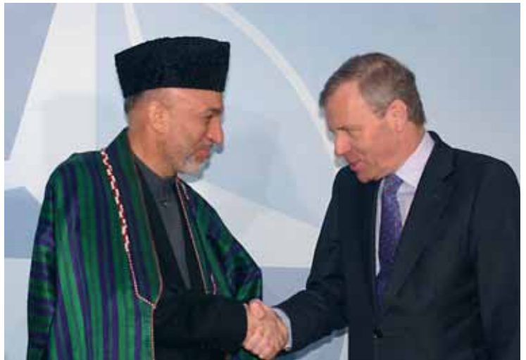
Enge Verbündete: NATO-Generalsekretär J. Scheffer mit dem afghanischen Präsidenten H. Karzai

Hier liegt der eigentliche Grund für den wachsenden Widerstand im Land: „Weil der Armutsbekämpfung keine Priorität eingeräumt wurde, kollabiert der Demokratisierungsversuch während die Afghanen verhungern.“ 46 Auf der Basis umfassender Feldforschung kommt der Senlis Council , ein Think Tank, der sich auf Afghanistan spezialisiert hat, zu dem Ergebnis, der wachsende Widerstand und die völlige Diskreditierung der westlichen Besatzungsmächte, hänge elementar damit zusammen, dass sich die humanitäre Situation seit 2001 massiv verschlechtert habe. Exemplarisch für viele in der Senlis-Studie zitierten Afghanen ist die Aussage eines Polizeikommandeurs aus Kandahar: „Die Ausländer kamen hierher und sagten, sie würden den armen Menschen helfen und die wirtschaftliche Situation verbessern, aber sie