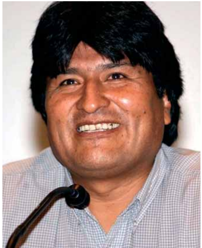
Der bolivianische Präsident Evo Morales

werden, dass Rechtssicherheit existiert und dass Abkommen eingehalten werden.“ 32 Bolivien verstößt jedoch mit seiner Politik gegen keine Abkommen, weder bilaterale noch internationale, weswegen die Regierung in Bolivien gelassen auf Androhungen, internationale Gerichte einzuschalten, reagiert.