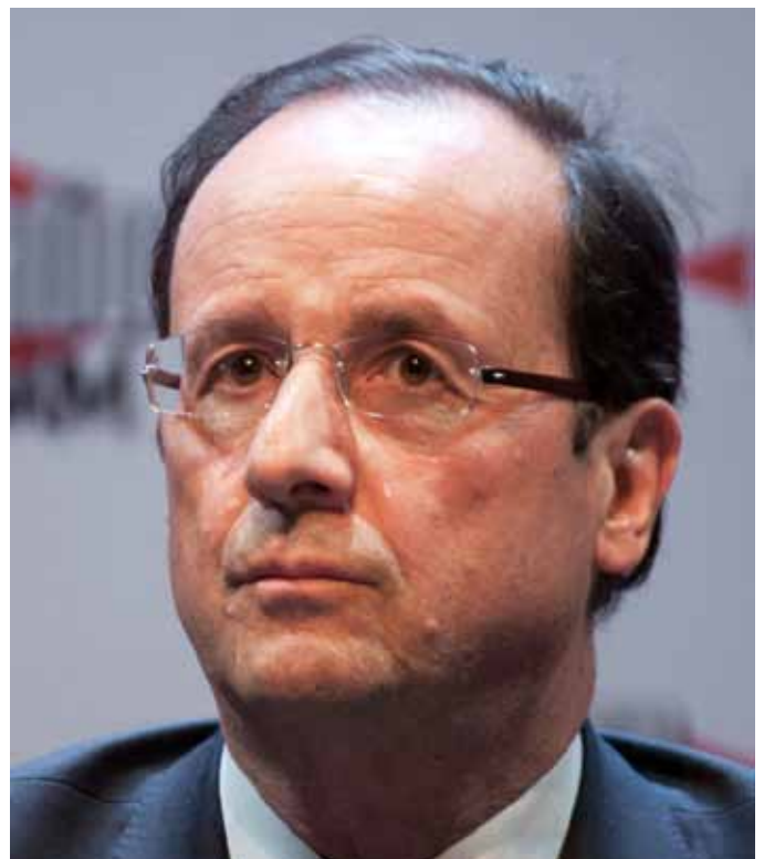
Französischer Staatspräsident François Hollande.

In Mali selbst gibt es Gold, Diamanten und Phosphat. Letzteres wird immer wichtiger für die weltweite Düngemittel-Produktion. Und es gibt Hinweise auf erhebliche Öl- und Gasreserven sowie auf Vorkommen von Uran in der Region um Kidal und Gao. 20 Damit schließt sich der Kreis: Wie in Mali, so gibt es in Niger ein Tuareg-Problem – und im ganzen Raum agieren AQIM & Co. Niger aber ist der drittgrößte Uranproduzent der Welt, Frankreichs über 80 Atomkraftwerke beziehen 70% ihres Brennstoffs aus Niger. Ausbeutet wird das Uran unter unsäglichen Bedingungen für Mensch und Umwelt von der halbstaatlichen französischen Firma Areva, die sich auf ihrer Homepage den größten Atomanlagenbauer der Welt nennt. Durch Niger wird die riesige fast 4.000 km lange Gas-Pipeline gebaut, die, finanziert von SONATRACH und Gazprom, von Nigeria zur algerischen Mittelmeerküste geführt wird. Der Sahel, und in seinem Zentrum Mali, ist daher von herausragender geo-strategischer Bedeutung, zumal inzwischen auch China begonnen hat, in Niger Uran abzubauen: Die derzeitigen Geostrategien richten sich nicht nur auf die Kontrolle der Fördergebiete, sondern noch mehr auf die Transportwege dieser Rohstoffe.