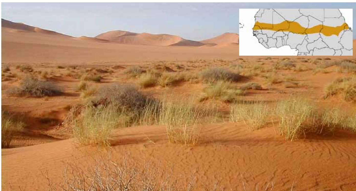
Sahara und Karte der Sahel-Zone. Foto: Florence Devouard, CC über Wikipedia; Karte: Wikipedia.

Das „Terrorismusproblem“ aber wurde seit 2003 politisch wie medial genutzt. Seit 2004 finden jährlich im ganzen Sahelraum unter dem Namen „Flintlock“ umfangreiche Manöver mit den