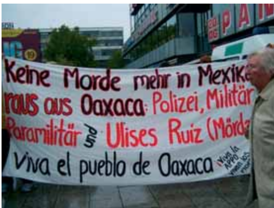
Oaxaca-Demonstration in Berlin, 4. Nov. 2006

Völlig ungeklärt bleibt letztlich bei allen Waffenexporten deren Nutzung nach erfolgter Lieferung. Dazu sagen die bereits erwähnten Politische Grundsätze der Bundesregierung für den Export von Kriegswaffen, „der Endverbleib der Kriegswaffen und sonstigen Rüstungsgüter ist in wirksamer Weise sicherzustellen.“ Aber wie soll das geschehen? Klar ist, dass gerade in den gewalttätigen Auseinandersetzungen in Mexiko, wie Ende Oktober in Oaxaca oder dem jüngsten Massaker im lakandonischen Regenwald in Chiapas auch paramilitärische Gruppen und sogar einzelne Polizisten in zivil involviert sind. So wurden ein örtlicher Polizist, ein Mitarbeiter der lokalen PRI-Administration, ein Sicherheitschef, sowie ein ehemaliges Mitglied der Para-