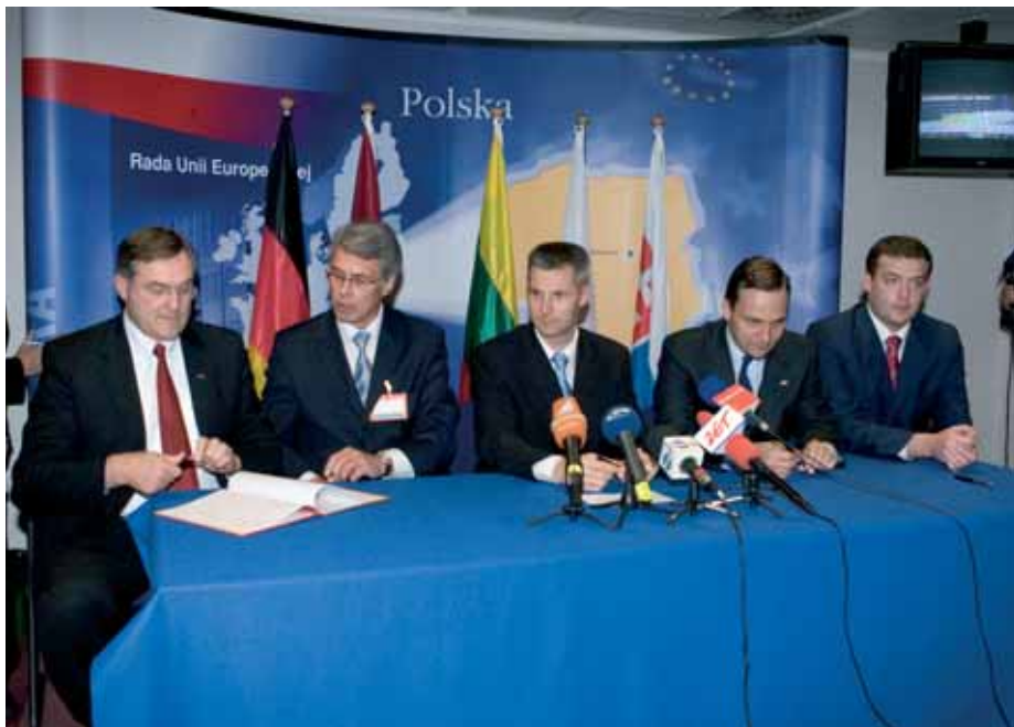
Unterzeichnung einer Vereinbarung zur Aufstellung von EU-Battlegroups zwischen Deutschland, Lettland, Litauen, Polen und der Slowakei

Verteidigungspolitik am Aufbau der „militärischen und zivilen Kapazitäten und einer effektiven zivil-militärischen Koordination“ weitergearbeitet werden. In der Folge wird aufgelistet, was alles konkret geplant ist. Die Grundlage dabei soll die Europäische Sicherheitsstrategie bilden. Besondere Betonung findet im Arbeitspapier die „Entwicklung einer strategischen Partnerschaft zwischen EU und NATO“ und die „Stärkung der Kooperation mit Schlüsselpartnern“. Hier wird insbesondere auf die USA verwiesen.