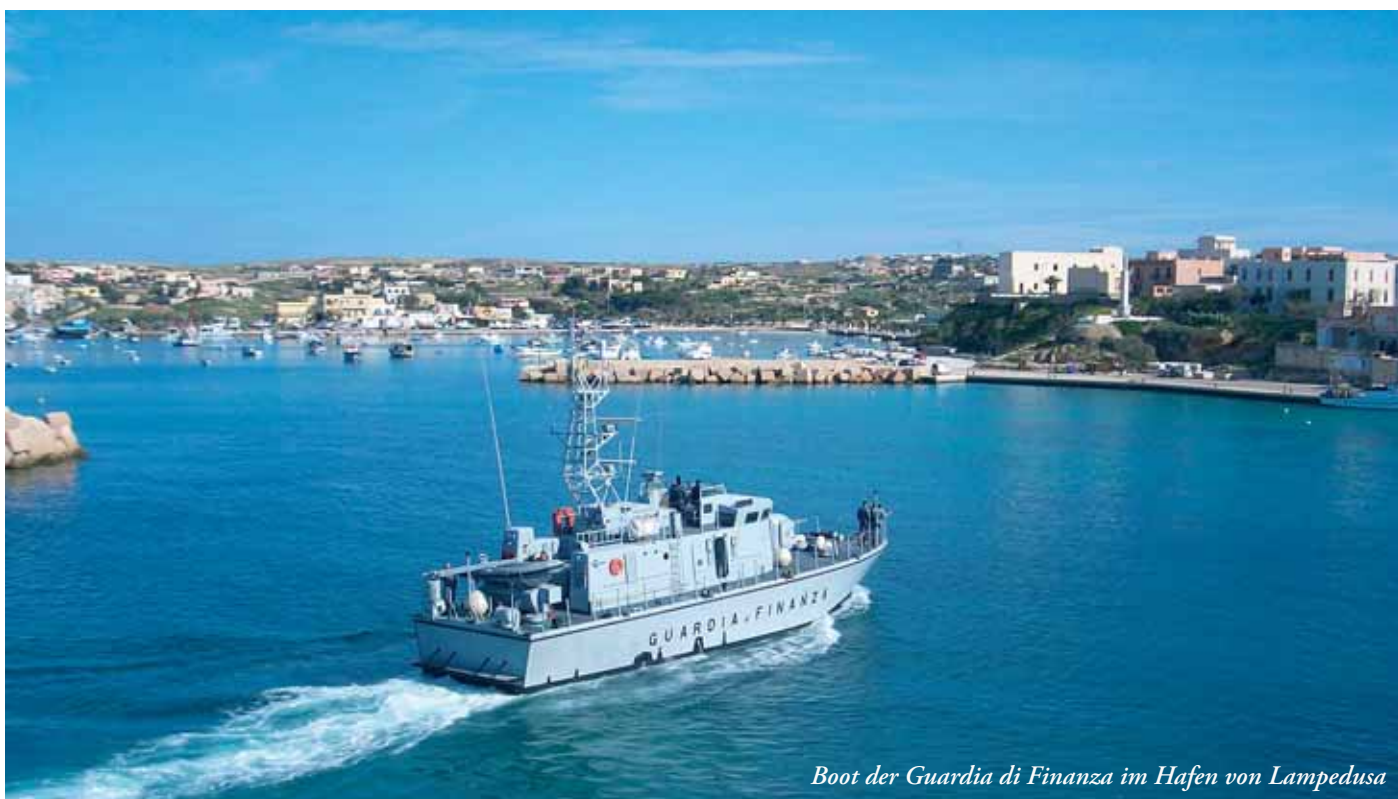
Boot der Guardia di Finanza im Hafen von Lampedusa

Bislang gab es eine Art sozialstaatlichen Kompromisses zwischen diesen marktliberalen Vorstellungen und dem Nationalismus, dem politischen Druck der nationalen Bevölkerung, gegenüber Zuwanderern privilegiert zu werden. Die arbeitsmarktpolitische Funktion des Staates ist es, die Arbeitskräfte politisch-rechtlich zu diskriminieren. In Zeiten des Wirtschaftswachstums, einer organisierten ArbeiterInnenmacht und des ideologischen Drucks durch den real existierenden Kommunismus, kurz: des Sozialstaats, geschah dies über soziale Rechte (Sozialhilfe, Arbeitslosengeld, Alten- und Krankenversicherung, Bildung etc.), die zuerst den BürgerInnen und abgestuft verschiedenen Kategorien von MigrantInnen zugesprochen wurden und so auch unterschiedliche Lohnniveaus sicherten. Gegenwärtig werden diese sozialen Rechte massiv und in ungeahnter Geschwindigkeit auch für die nationale Bevölkerung abgebaut. Das oben beschriebene Wohlstandsleben kann nur noch von einer immer kleiner werdenden Schicht geführt werden und muss von einem boomenden Sektor der Sicherheitstechnologien und -dienstleistungen abgesichert werden. Wer über keine ausreichenden Vermögenswerte verfügt, wird in einem prekären