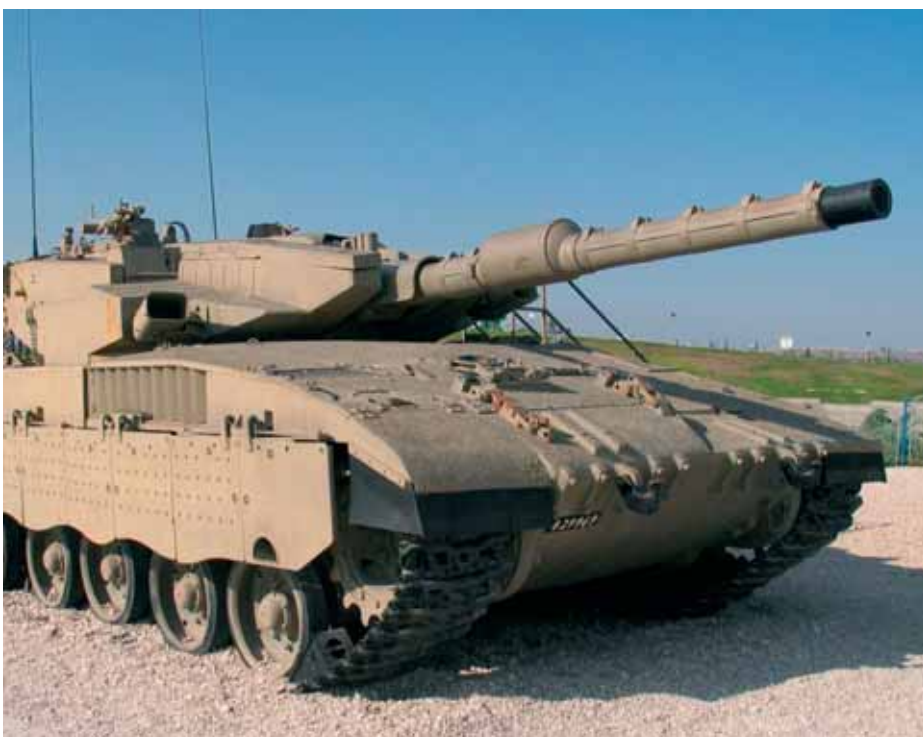
Israelischer Panzer mit deutschem Motor: Merkava