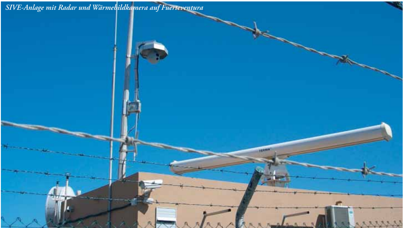
SIVE-Anlage mit Radar und Wärmebildkamera auf Fuerteventura

aufwändigen Maßnahmen zur Sicherung der Außengrenzen zwingen einen Teil der MigrantInnen dazu, ihr Leben zu riskieren, ihre Dokumente zu vernichten und damit auch ihre Rechte aufzugeben. In Spanien werden die kleinen Boote, mit denen die ImmigrantInnen ankommen, Pateras genannt – Opferschalen. Ihre Bergung obliegt allein den polizeilichen und militärischen Behörden und geschieht im Kontext eines permanenten Ausnahmezustands in den sich räumlich ausdehnenden und diffundierenden Grenzregionen. Die Rettung von Bootsflüchtlingen durch zivile Organisationen wurde durch sich kontinuierlich und auf Druck der EU global verschärfenden Anti-Schleuser-Gesetze und am Fall der Kap Anamur spektakulär kriminalisiert. Der Umgang der Behörden mit den Angekommenen lässt sich nicht an Maßstäben der Menschenrechte messen oder beschreiben, ihre Rettung erscheint humanitär und der Umgang mit ihnen willkürlich. Das heißt nicht, dass er rein repressiv oder in erster Linie von Gewalt geprägt wäre, viele der Grenzbeamten und Soldaten können durchaus Mitleid mit den Clandestini aufbringen. Jedoch kann in diesem Kontext alles passieren: Sicherheitskräfte können die Menschen einfach ertrinken lassen und Hilferufe ignorieren, an den Grenzen auf sie schießen, wie es in Ceuta und Melilla geschehen ist. Sie können sie schlagen, demütigen und einsperren, massenhaft abschieben und in der Wüste aussetzen. Wenn sie dies nicht tun, den dem Tode entronnenen Immigran-