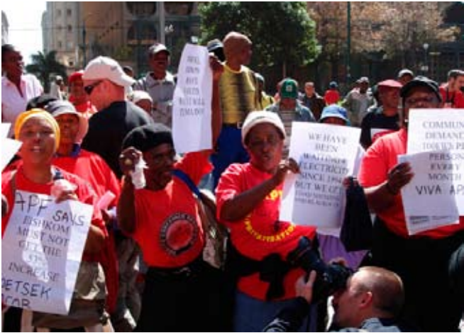
Protest gegen Strompreiserhöhungen in Johannesburg, Foto: indymedia (Südafrika)

richtenagentur AFP. „Ich glaube nicht, dass es irgendetwas Gutes für das Land bringt.“ 12 In Anbetracht der WM 2010 würde das nur zu Irritationen über die Sicherheitslage im Land führen, so Zuma weiter.