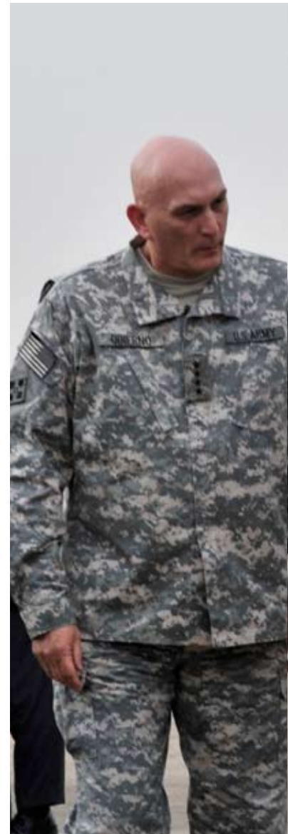
US-Präsident Obama mit Gen. Ray Odierno, Kommandierender der Multinationalen Truppen im Irak im April 2007

Viele US-Experten sind daher überzeugt, dass ungeachtet der wiederholten Versicherungen Obamas, dass Ende 2011 wirklich die letzten Truppen das Land verlassen werden, dies nicht das letzte Wort sein wird. Man sollte ihnen nicht glauben, so der renommierte Autor und frühere Militärexperte der Washington Post Thomas Ricks, da es nicht passieren werde. Er sei überzeugt, dass noch zehntausende US-Truppen im Irak sein werden, wenn Präsident Obama sein Amt verlässt. 32 Die New York Times ließ in einem Leitartikel, der in Washington erhebliche Wellen schlug, ausführlich begründen, warum eine solche