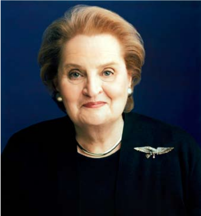
Vorsitzende der „Hochrangigen Gruppe“; Ex-US-Außenministerin Madeline Albright

NATO mitmischen will, so bleibt von irgendwelchen Beschränkungen wenig übrig: Afrika, Asien, Russland, Zentralasien und der Kaukasus sowie natürlich der Mittlere Osten, alles Gegenden, in denen Interessen der Allianz betroffen seien – und in denen nötigenfalls dann eben auch Kriegseinsätze erforderlich werden. Sucht man genauer, so findet man exakt eine Region, die aus der NATO-Zuständigkeit ausgeklammert wird: „Die lateinamerikanische und pazifische Region hat, ebenso wie Nordamerika ihre Probleme, vor allem Kriminalität. Die Organisation Amerikanischer Staaten ist die vorrangige regionale Organisation für beide Kontinente. Somit, mit der möglichen Ausnahme eines humanitären Notfalls, ist eine direkte NATO-Involvierung in diese Region schwer vorstellbar.“ (S. 17)