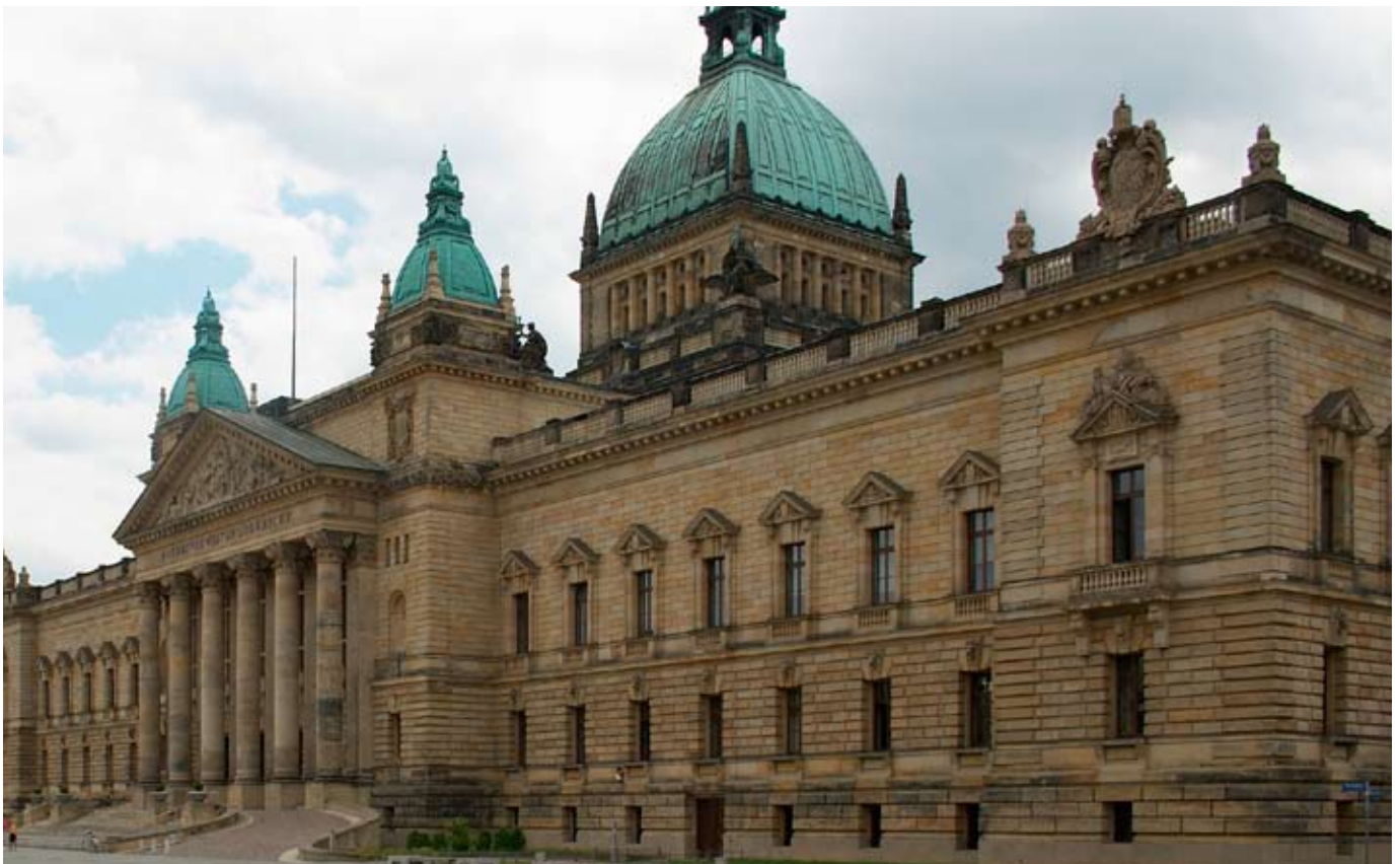
Bundesverwaltungsgericht in Leipzig, Foto: Appaloosa, gnu/cc-Lizenz unter wikimedia