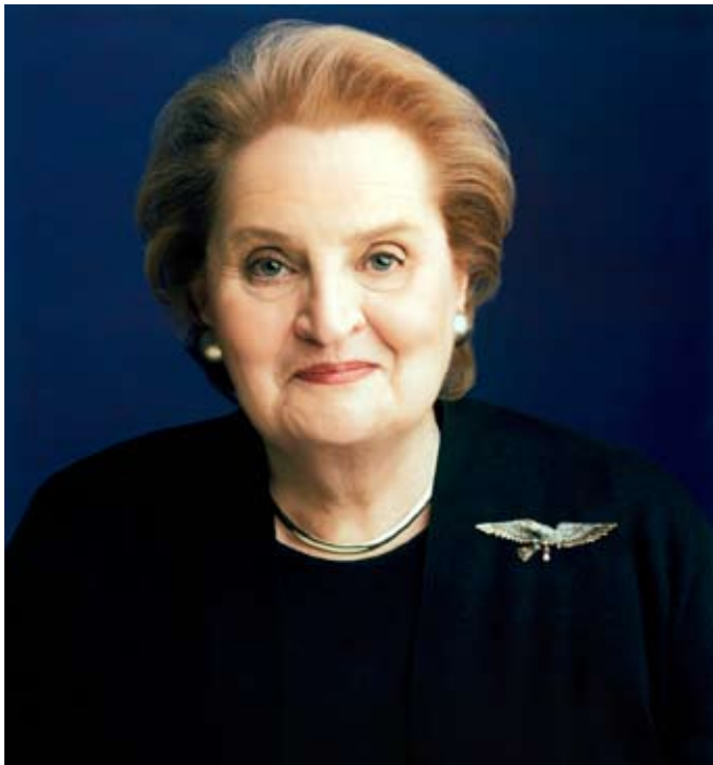
Vorsitzende der „Hochrangigen Gruppe“; Ex-US-Außenministerin Madeline Albright

NATO mitmischen will, so bleibt von irgendwelchen Beschränkungen wenig übrig: Afrika, Asien, Russland, Zentralasien und der Kaukasus sowie natürlich der Mittlere Osten, alles Gegenden, in denen Interessen der Allianz betroffen seien – und in denen nötigenfalls dann eben auch Kriegseinsätze erforderlich werden. Sucht man genauer, so findet man exakt eine Region, die aus der NATO-Zuständigkeit ausgeklammert wird: „Die lateinamerikanische und pazifische Region hat, ebenso wie Nordamerika ihre Probleme, vor allem Kriminalität. Die Organisation Amerikanischer Staaten ist die vorrangige regionale Organisation für beide Kontinente. Somit, mit der möglichen Ausnahme eines humanitären Notfalls, ist eine direkte NATO-Involvierung in diese Region schwer vorstellbar.“ (S. 17)