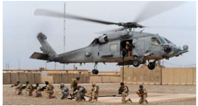
Irakische Spezialtruppen üben mit einem us-amerikanischen Hubschrauber im Irak 2007, Foto: US-Navy, David Rush

In spektakulären Auktionen bot der Irak zwar 2009 ausländischen Konzernen Abkommen zur Ausbeutung von umfangrei-