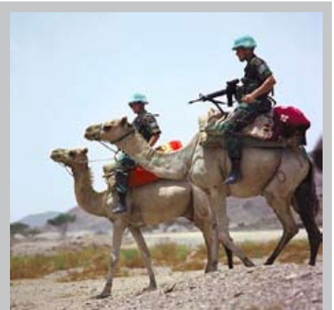
Bild: UN-Soldaten in Eritrea, Foto: Dawit Rezene, www.world66.com über wikimedia

der UN erfuhren. UN-Peacekeeping bedeutet daher nicht mehr den Schutz von Pufferzonen mit blaubehelmtten SoldatInnen zu gewährleisten, sondern genuin den Aufbau von Staatlichkeit zu betreiben, robuste Militäreinsätze zu führen und alles andere als überparteilich zu sein, wenn Entscheidungsstrukturen fast ausschließlich von Militärs der EU und NATO besetzt sind.