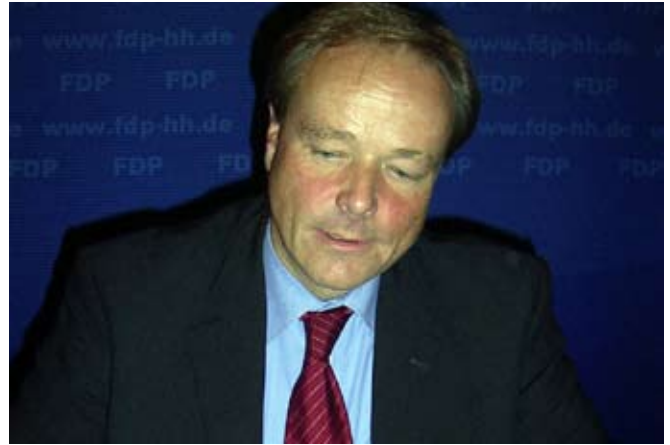
Entwicklungshilfeminister Dirk Niebel bei einer Veranstaltung 2007

Die Entscheidung, den Posten des Entwicklungsministers ausgerechnet mit Niebel zu besetzen, der zuvor die Abschaffung eben jenes Ministeriums gefordert hatte, hat in der Presse zunächst vor allem zu Erheiterungen geführt. Es sei vor allem das Geifern nach dem Posten ausschlaggebend gewesen. Es wäre aber inzwischen an der Zeit, die Argumente der Regierung und Niebels selbst, es gehe vielmehr um eine kohärente Außenpolitik, ernst zu nehmen. Ein Entwicklungshilfeministerium, das eben deutsche Wirtschafts- und Sicherheitsinteressen vertritt, dient diesem Anspruch weit mehr als eine Abteilung für Ent-