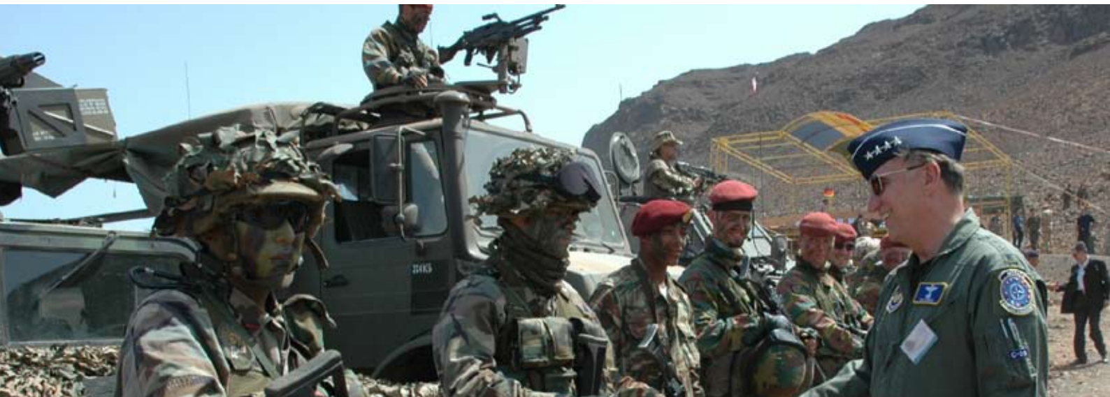
Die NATO Response Force beim Manöver „Steadfast Jaguar“ auf den Kapverden.

paket (Prague Capabilities Commitment), das die Verbesserung der Kriegskapazitäten in 400 Bereichen mitsamt konkreten Zeitvorgaben beinhaltet und im Gegensatz zur vorangegangenen Defence Capabilities Initiative bindend war. Vor allem wurde dort aber die Entscheidung getroffen, eine Schnelle Eingreiftruppe (NATO Response Force, NRF) im Umfang von etwa 25.000 Soldaten aufzustellen, die in kürzester Zeit weltweit in Kriegeinsätze geschickt werden kann. Bereits am 15. Oktober 2003 wurde die NRF für begrenzt einsatzfähig erklärt, erste Missionen zur Katastrophenhilfe und erste Militärmanöver folgten kurze Zeit später.