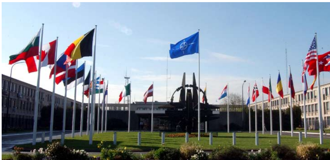
NATO-Hauptquartier in Brüssel

52 Allerdings ist schon heute die so genannte konstruktive Enthaltung möglich, mit der sogar ein Dissens ohne Veto artikuliert werden kann.