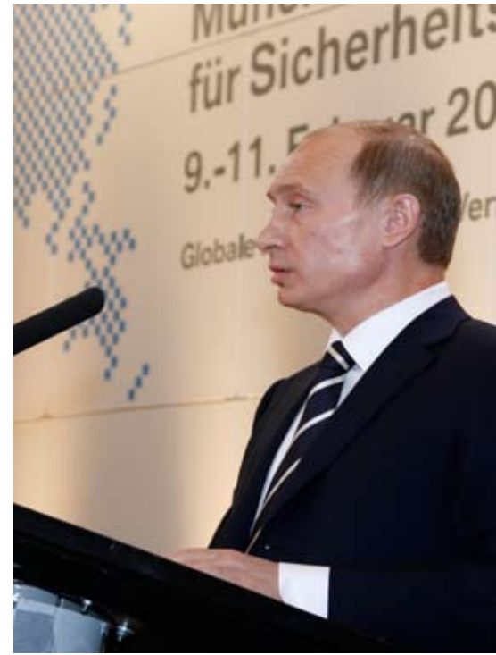
Der Russische Präsident, Wladimir W. Putin während seiner Rede auf der Sicherheitskonferenz München 2007.

dazu gezwungen wird, einer ausländischen Erpressung aufgrund der Einstellung der Energieversorgung nachzugeben und einem Mitglied, dass sich einer militärischen Blockade oder einer militärischen Demonstrationen an seinen Grenzen gegenüber sieht.“ 40