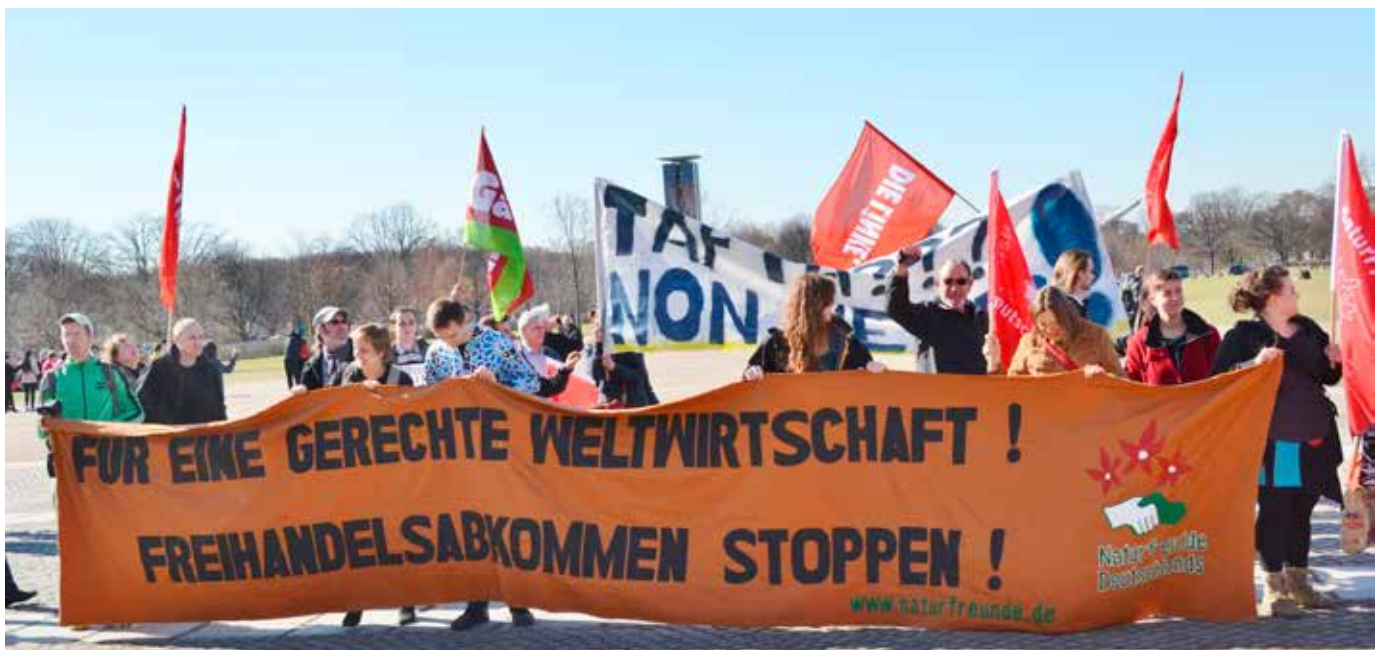
Protest gegen TTIP.

Ganz konkret wird die Möglichkeit betont, mit dem TTIP die politische und ökonomische Militärkooperation zwischen den Regierungen und Konzernen der EU und den USA zu vertiefen, was dann ganz direkt zur Stärkung der NATO beitragen würde. So geht Gustavo Plácido dos Santos davon aus, die US-amerikanische „Militärzusammenarbeit mit der EU [werde sich] sicherlich mit der Durchsetzung des TTIP vertiefen.“ 49 Charles Kupchan argumentiert exemplarisch, dass die NATO in Schwierigkeiten sei: Die Kriege in Afghanistan und Libyen verliefen nicht wie geplant, außerdem würden die Rüstungsausgaben in der EU zurückgehen. Deshalb hält er das Abkommen für enorm wichtig: Durch die Verhandlungen um das Abkommen werde auch der Dialog im privaten Rüstungssektor vorangebracht. 50 In einem Video auf der Homepage der NATO kommen Vertreter des Rüstungssektors zu Wort und betonen die Möglichkeit, dass der transatlantische Rüstungsmarkt durch das TTIP enger zusammenwachsen könne: Die schrumpfenden Verteidigungshaushalte auf beiden Seiten des Atlantiks würden den Rüstungskonzernen