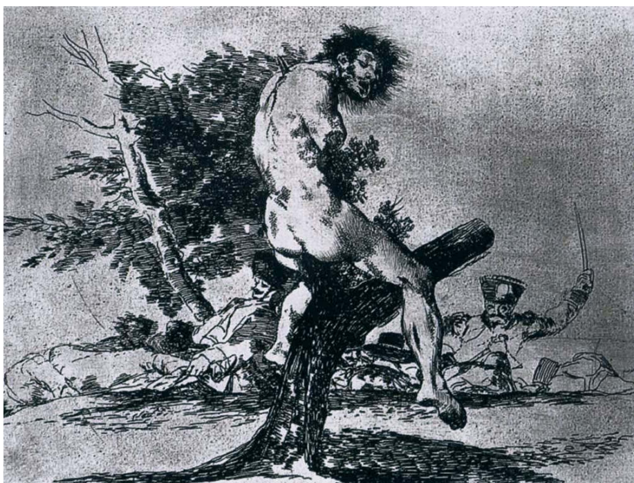
Im Widerspruch zu seinen eigenen Thesen illustriert auch Herfried Münkler sein Buch mit Bildern aus Francisco Goyas „Desastres de la guerra“ (1810-15), die die Grausamkeit damaliger innerstaatlicher Kriege beschreiben.

Mary Kaldor etwa vertritt die These, dass die ideologisch-politischen Auseinandersetzungen vergangener Zeiten „durch eine neue politische Frontstellung abgelöst worden sind: die zwischen einer, wie ich es nennen werde, kosmopolitischen, also auf Werten der Einbeziehung, des Universalismus und Multikulturalismus basierenden Politik und einer Politik partikularer Identitäten.“ 20 Mit einer schier unglaublichen Arroganz wird hier propagiert, der „Import von Staatlichkeit“ und damit Frieden, sei nur durch den Export westlicher Ordnungsvorstellungen zu gewährleisten: „Die Analyse der neuen Kriege legt jedoch nahe, dass nicht Friedenssicherung, sondern die Durchsetzung kosmopolitischer Normen erforderlich ist, also die Durchsetzung des humanitären Völkerrechts und der Menschenrechte.“ 21 Westliche Pazifizierungskriege