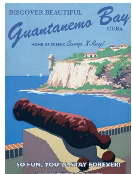
Grafik: propaganda remix projekt