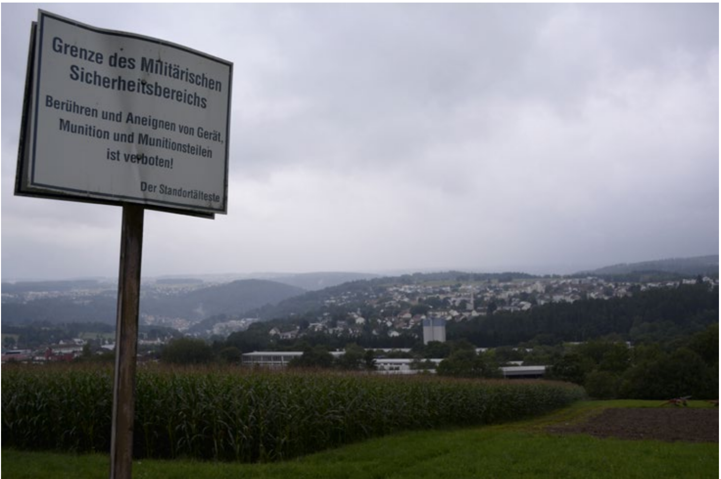
Die Graf-Zeppelin-Kaserne und das dazugehörige Übungsgelände in Calw.

wurde und daraufhin zum Teil im KSK aufging. Vor 1996 gab es mehr Kontakt zwischen Soldat_innen und Calwer Bürger_innen.