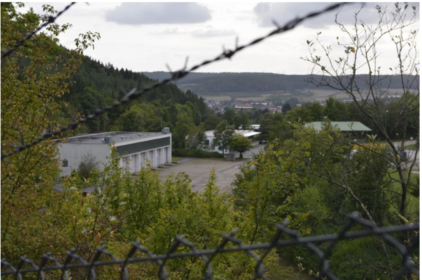
Die leerstehende Carl-Schurz-Kaserne im September 2017.

Kurz vor dem Einzug der neuen Einheit, die dem KSK unterstellt ist, gab es jedoch Proteste. Die Rhein-Neckar-Zeitung berichtet, es sei am 7. und 8. September im Rahmen einer Verleugung zu Störungen gekommen: „Krieg macht Terror‘ und ‚Nein zum KSK‘. Mit diesen Parolen haben Bundeswehrgegner am Donnerstag und Freitag in Hardheim für Unruhe gesorgt. Am Donnerstag blockierten sie auf der Panzerstraße einen Teil eines insgesamt 30 Fahrzeuge umfassenden Konvois der Bundeswehr. [...] Am Freitag wurde dann in Hardheim ein Flyer verteilt - und wohl vereinzelt auch in Briefkästen eingeworfen -, der sich explizit gegen das Kommando Spezialkräfte und gegen die Stationierung einer neuen Einheit der Bundeswehr in der Carl-Schurz-Kaserne richtet. [...] Die Ermittlungen des Staatsschutzes laufen.“ 47 Es wird jedoch vermutet, dass die Protestierenden nicht aus der Region stammen. Kaum überraschend solidarisierte sich der Hardheimer Bürgermeister Volker Rohm umgehend reflexartig mit der Bundeswehr: „Hardheim stand schon immer zur Bundeswehr, und Hardheim steht auch weiter-