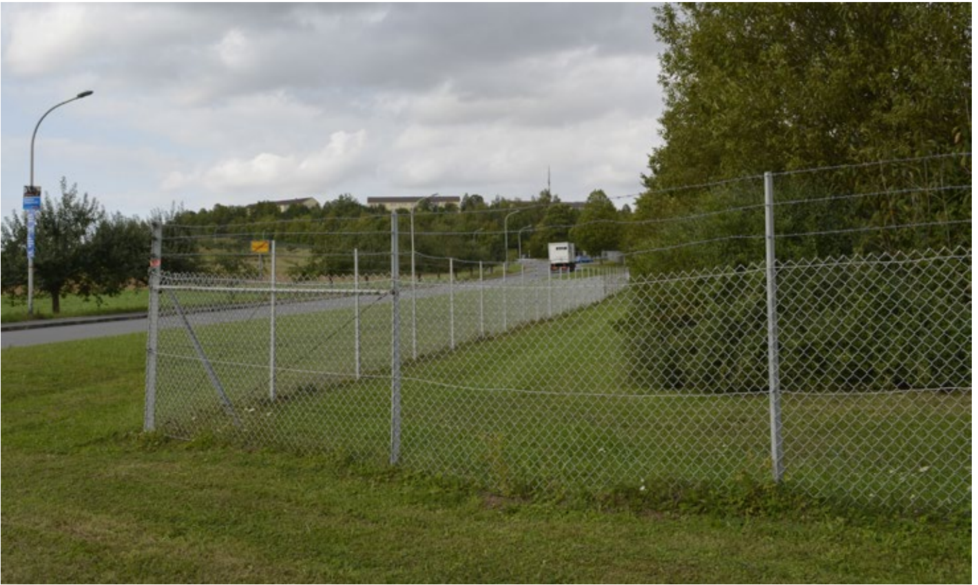
Auf der Carl-Schurz-Kaserne in Hardheim entsteht zur Zeit ein NATO-Hauptquartier für Spezialeinsätze.

des Gebiets wäre also – entgegen der Behauptungen vieler Lokalpolitiker_innen – durchaus wirtschaftlich möglich gewesen. Die Bundeswehr zeigte sich jedoch nicht gesprächsbereit und möchte eine mögliche Konversion sogar noch über das eigentlich angeordnete Jahr 2019 hinaus verzögern oder verhindern. Nach mehrjährigen Bemühungen gab der Investor nun im August 2017 auf und gab in der Lokalzeitung bekannt: „Das Depot ist für uns kein Thema mehr!“. 42 Eine Chance, das Gelände auf dem Wurmberg einer für die Region gewinnbringenden zivilen Nutzung zuzuführen, wurde somit vertan.