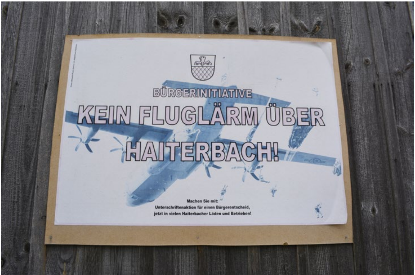
Plakat der BI gegen das militärische Absprunggelände in Haiterbach.

auf der Gegenseite stehen, halten die geforderten Gebietsabtritte für existenzgefährdend. Die drei Landwirte möchten ihre Böden, die zu den fruchtbarsten in der Region gehören, nicht verkaufen. Anfangs beteuerten Regierungsvertreter_innen, Enteignungen werde es nicht geben. Mittlerweile wird der Druck auf die Grundeigentümer_innen erhöht und Enteignung als letztes Mittel angedroht. Die Landwirte lassen sich davon jedoch bisher nicht einschüchtern. 20