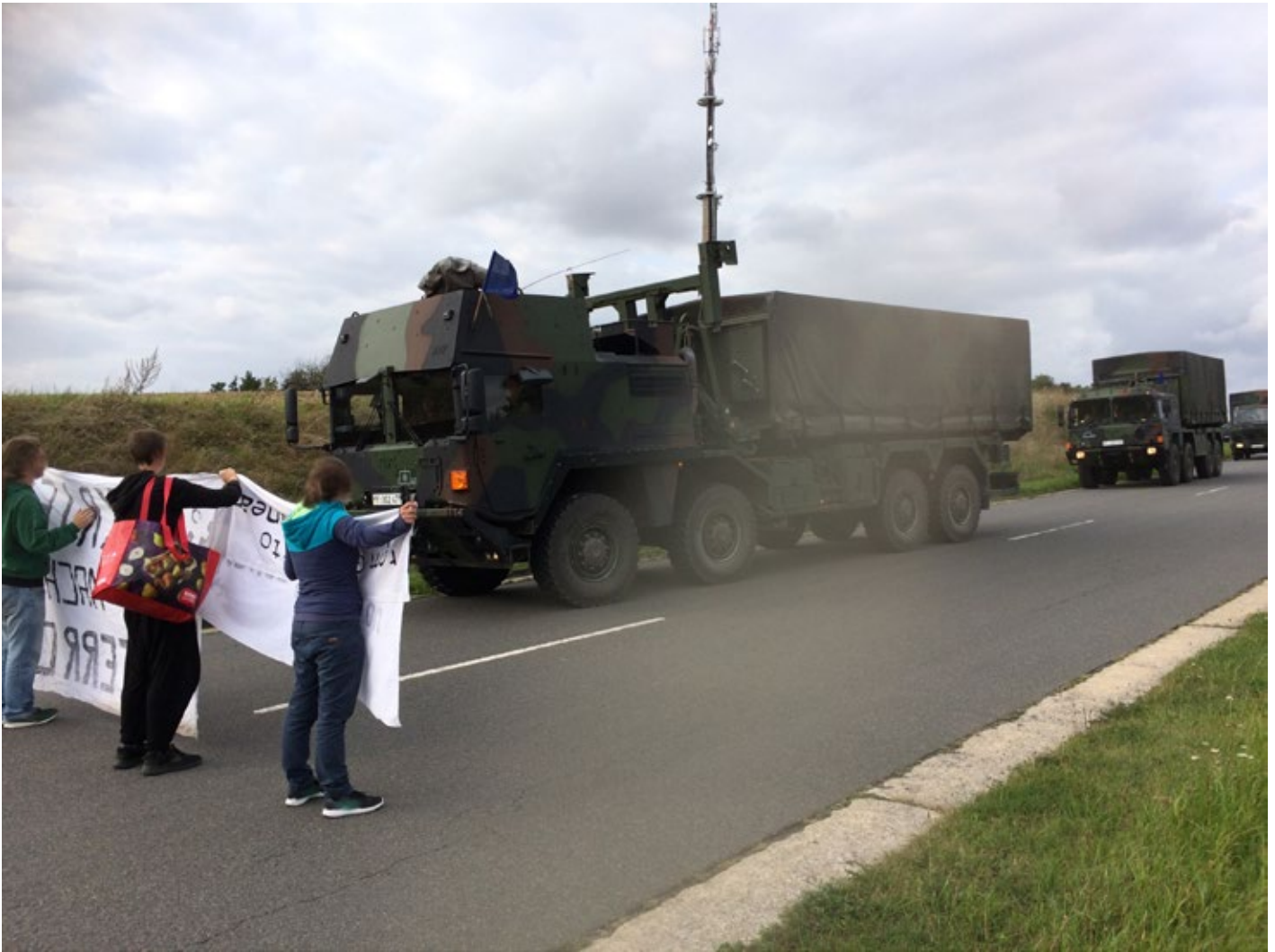
Protest gegen das NATO-Hauptquartier in Hardheim.

Diskussion über die wirtschaftliche Machbarkeit von Abrüstung verstellen den Blick auf das ebenfalls alltägliche Unrecht, das das Militär weltweit verursacht.