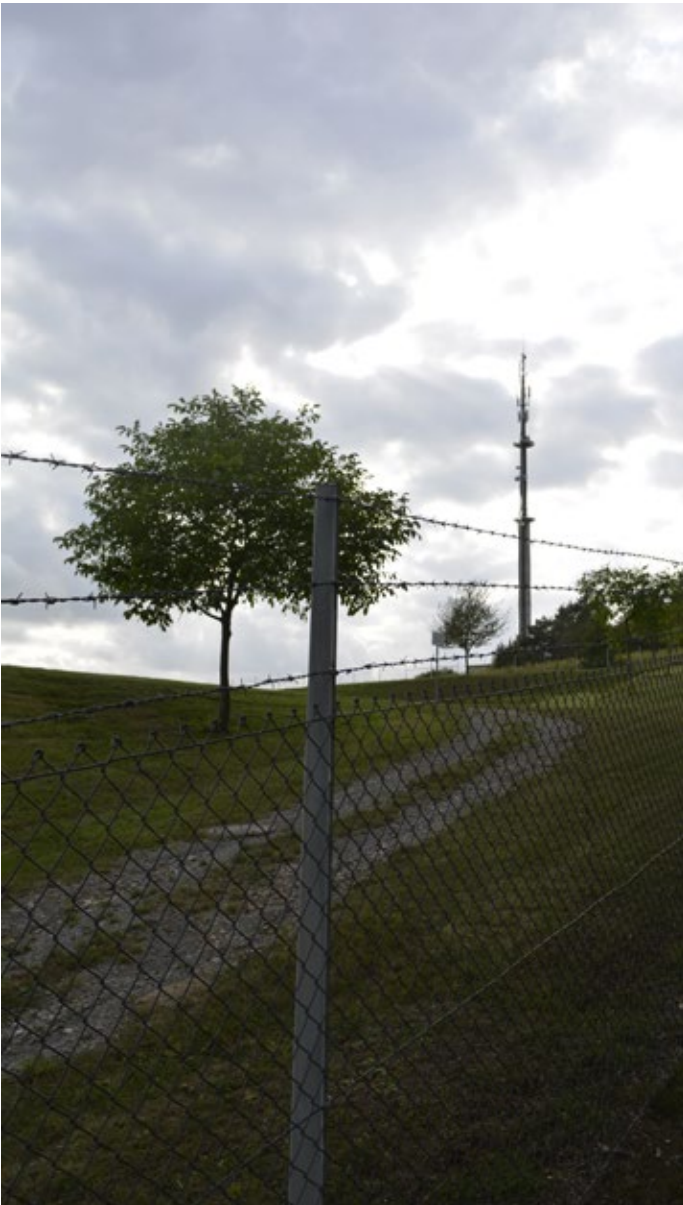
Bis 2020 soll die Kaserne mit umfangreicher IT und Fernmeldetechnik ausgestattet werden.

tet werden. Die neue Kompanie soll jedoch nicht dauerhaft in Hardheim stationiert sein. Es handle sich nur um eine Zwischenunterbringung. Über die Zielstationierung gebe es noch keine Entscheidung, so ein Bundeswehresprecher. 36 Immer wieder im Gespräch ist auch die Verlegung eines Panzerbataillons nach Hardheim, die sich einige Lokalpolitiker_innen erhoffen. Dies ist momentan jedoch eher unwahrscheinlich. 37 Das eigentlich aufgegebene und zum Teil bereits zivil genutzte Gelände wird nun somit wieder militärisch genutzt. Es erhält sogar eine für die NATO-Kriegsführung in aller Welt äußerst zentrale Funktion als multinationales Hauptquartier für Spezialeinsätze. Es stellt somit ein typisches Beispiel für die zweite Form von Gegenkonversion dar: die Reaktivierung aufgegebener Flächen, Liegenschaften und Ressourcen durch das Militär.