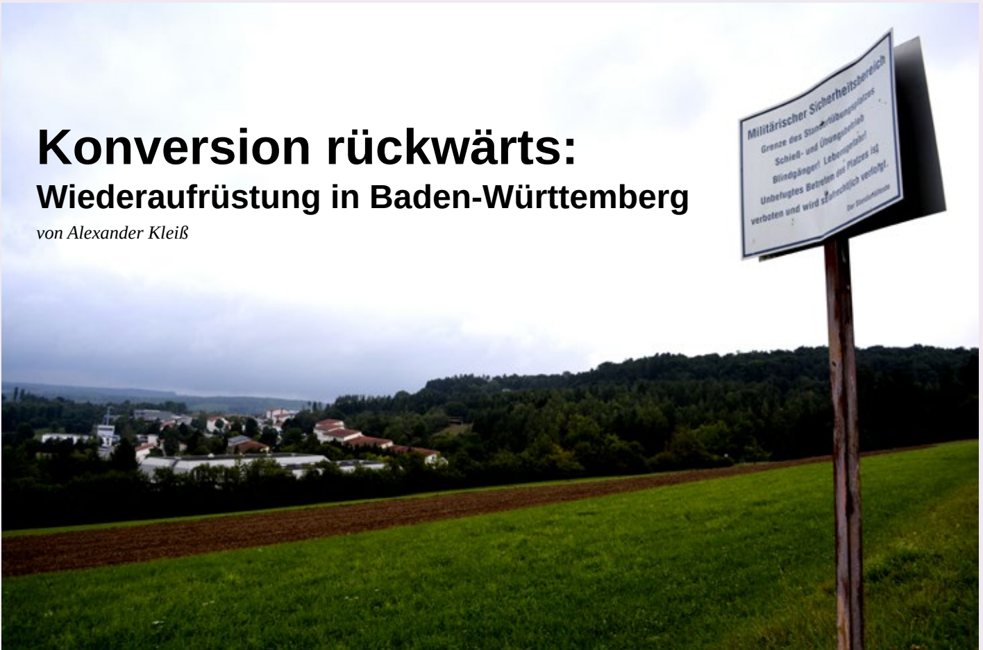
Graf-Zeppelin-Kaserne in Calw.