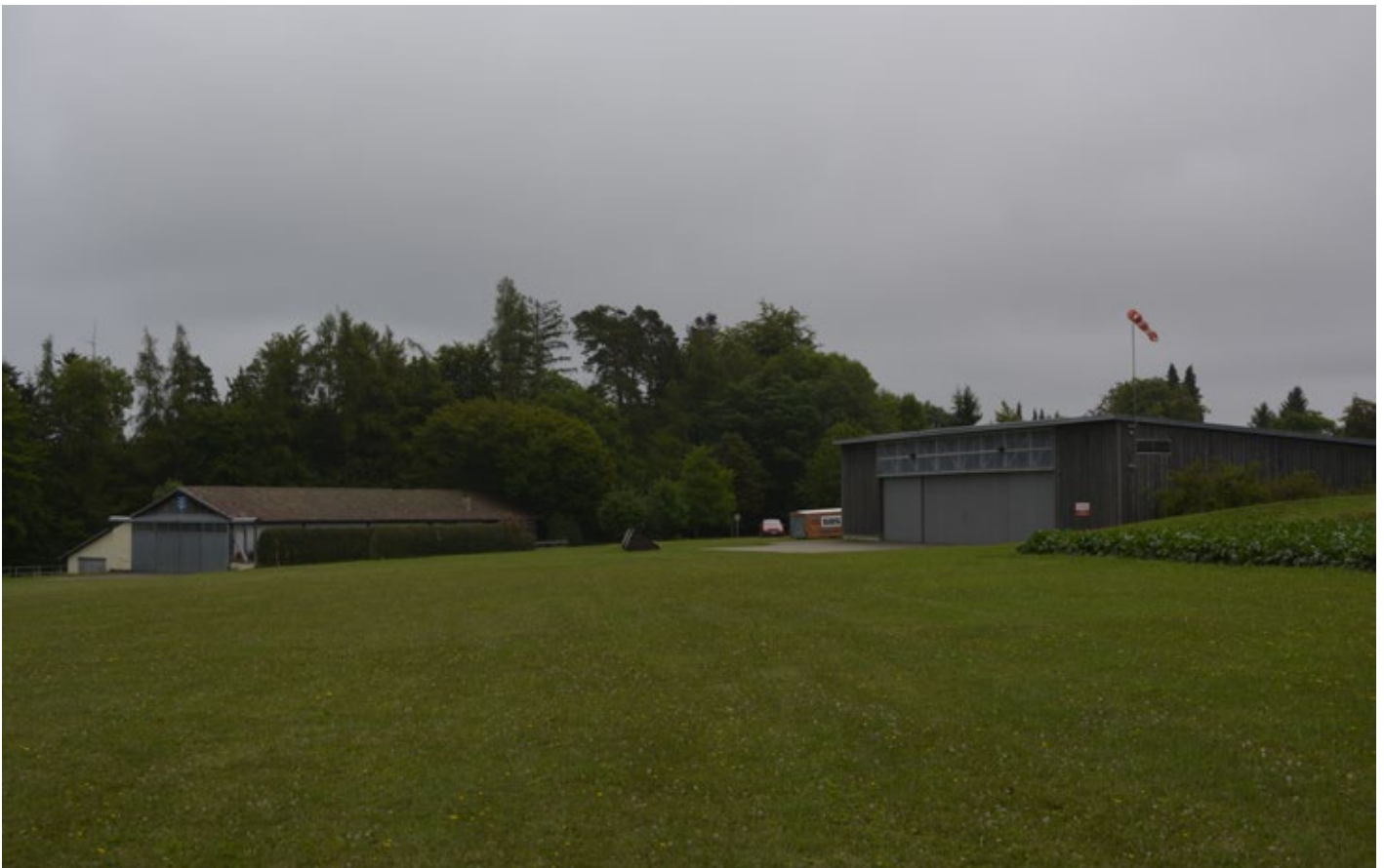
Auf dem Segelflughafen in Haiterbach soll das KSK künftig Fallschirmabsprünge trainieren.

Das neue Absprunggelände soll eine Fläche von 55 Hektar umfassen. Hierfür müsste der bisherige Flugplatz erheblich erweitert werden. Die dafür erforderlichen Flächen befinden sich momentan im Besitz von etwa 50 verschiedenen Eigentümer_innen. Hauptsächlich handelt es sich dabei um landwirtschaftlich genutztes Gebiet. Davon werden allein 39 Hektar von drei Landwirten bewirtschaftet. Sie stehen vor einem existenziellen Problem. Von der Landsiedlung (einer GmbH des Landes Baden-Württemberg, die für Immobilienangelegenheiten zuständig ist), die als Verhandlungspartner fungiert, wurden zwar Ersatzflächen angeboten; diese sind jedoch weiter entfernt von den Höfen der Landwirte und wären somit durch die weiteren Wege nicht wirtschaftlich. Außerdem würde das zusammenhängende Anbaugelände zersplittert. Sogar die Verhandlungspartner_innen der Landsiedlung, die für das Land verhandeln und somit eigentlich