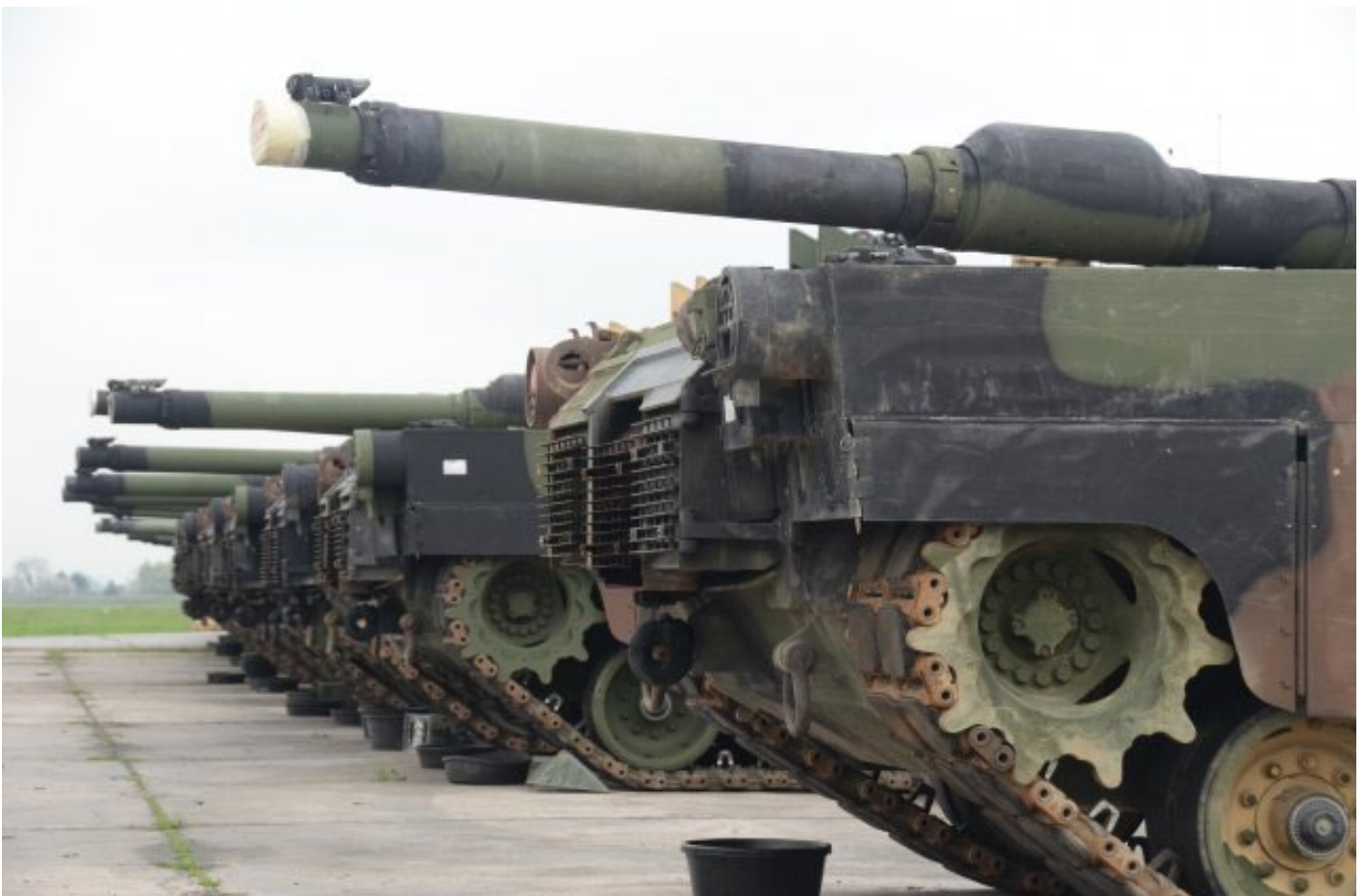
Panzer auf dem Coleman-Areal in Mannheim.

Einen Spezialfall stellt jedoch das mit 216 Hektar sehr große