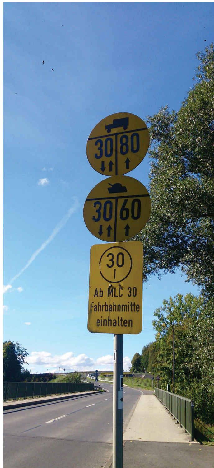
Die Straßenschilder für Militärischen Lastenklassen wurden schrittweise abmontiert. Kommen sie nun im Rahmen von „Military Schengen“ zurück?

Genau dies wurde nun umgesetzt: Zwar laufen die anvisierten 6,5 Milliarden wie erwähnt unter dem Budgettitel „Sicherheit und Verteidigung“, sie sollen aber dem Instrument „Connecting Europe Facility“ zugeordnet werden. Laut Eigenaussage beabsichtigt die EU, mit der CEF „Wachstum, Arbeitsplätze und Wettbewerbsfähigkeit durch gezielte Infrastrukturinvestitionen auf EU-Level zu fördern“. 12 Nichts davon wird jedoch durch