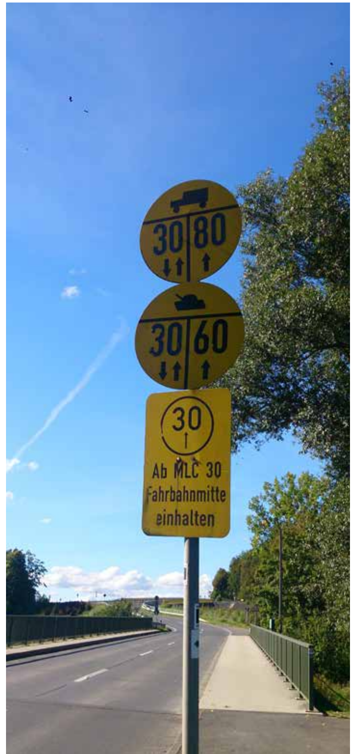
Die Straßenschilder für Militärischen Lastenklassen wurden schrittweise abmontiert. Kommen sie nun im Rahmen von „Military Schengen“ zurück?

Genau dies wurde nun umgesetzt: Zwar laufen die anvisierten 6,5 Milliarden wie erwähnt unter dem Budgettitel „Sicherheit und Verteidigung“, sie sollen aber dem Instrument „Connecting Europe Facility“ zugeordnet werden. Laut Eigenaussage beabsichtigt die EU, mit der CEF „Wachstum, Arbeitsplätze und Wettbewerbsfähigkeit durch gezielte Infrastrukturinvestitionen auf EU-Level zu fördern“. 12 Nichts davon wird jedoch durch