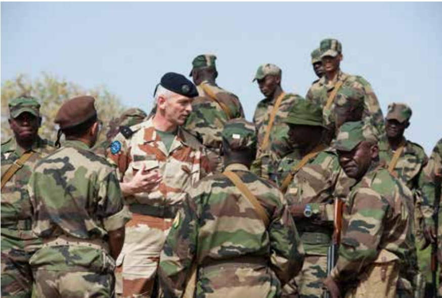
Französischer General bei der Ertüchtigungsmission EUTM Mali.

Machtprojektion und Rüstungsexporte als auch Kontrolle über andere Länder ermöglicht, ohne sich auf langfristige, teure und personalintensive Einsätze einlassen zu müssen – auch wenn sie sich gegenseitig nicht ausschließen müssen! 27