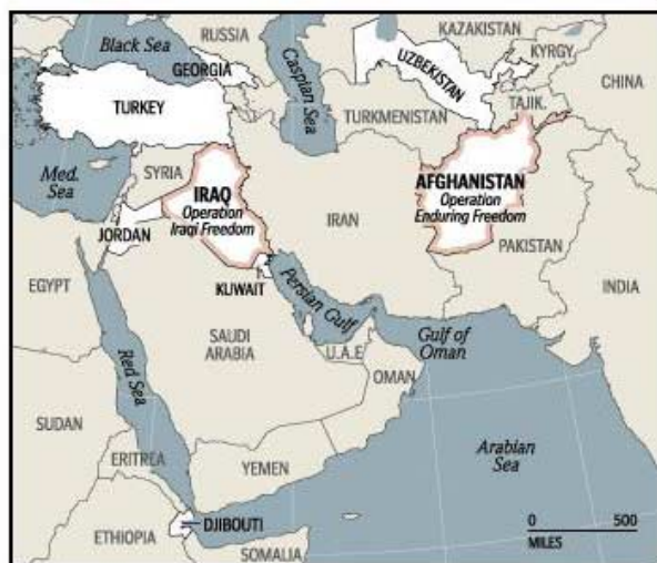
Brown and Root, a subsidiary of oil giant Halliburton, has won nearly $2 billion in contracts for the war on terror. Here is a breakdown of some of the work orders assigned to the company by the Department of Defense.