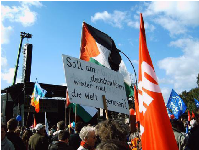
Demonstration gegen den Afghanistaneinsatz in Berlin

ein deutscher Offizier im Stab der niederländischen luftbeweglichen Kräfte für sechs Monate eingesetzt. Zuvor war bereits ein anderer Offizier als „Austauschoffiziere“ bei der britischen Luftwaffe eingesetzt. Ohne die Unterstützungsflüge sind damit Anfang August 2007 insgesamt 36 deutsche Soldaten „vorübergehend“ im Süden eingesetzt. Die ohnehin fadenscheinige Trennung zwischen OEF und ISAF wird jedoch mit dem Einsatz deutscher Tornados endgültig zur Farce.