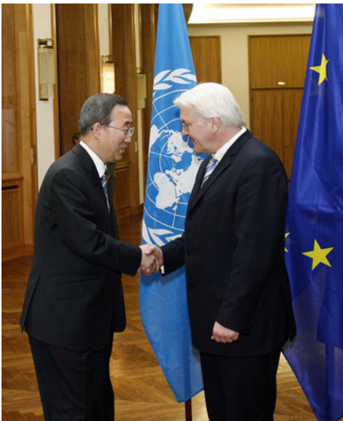
UN-Generalsekretär Ban Ki-moon und der deutsche Außenminister Steinmeier am 21.2.2007 in Berlin.

Ebenfalls 2003 richtete die Europäische Union eine „African Peace Facility“ mit einem Budget von 250 Mio. Euro für die Afrikanische Union (AU), insbesondere deren Militäreinsätze und die Evaluierung dieser ein. 18 Die Hälfte des Betrages wird direkt aus dem Europäischen Entwicklungsfond bereitgestellt, die andere Hälfte müssen die afrikanischen Staaten anteilig von ihren Geldern, die sie im Rahmen des Cotonou-Abkommens aus demselben Topf erhalten, beisteuern. Will die AU jedoch eine Mission durchführen und diese Mittel abrufen, muss sie eine entsprechende