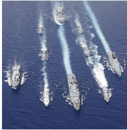
Deutsche, dänische und schwedische Marine beim gemeinsamen Training vor Süd-Libanon

Über Wasserwerfer, deren Strahl zum Leiten elektrischer Ströme verwendet wird, soll es zukünftig auch möglich sein, größere Menschenmengen gleichzeitig durch elektrischen Strom bewegungsunfähig zu machen. Weitere Systeme sind im Test oder werden bereits bereitgehalten, die durch Schallwellen oder Geruchsstoffe Übelkeit