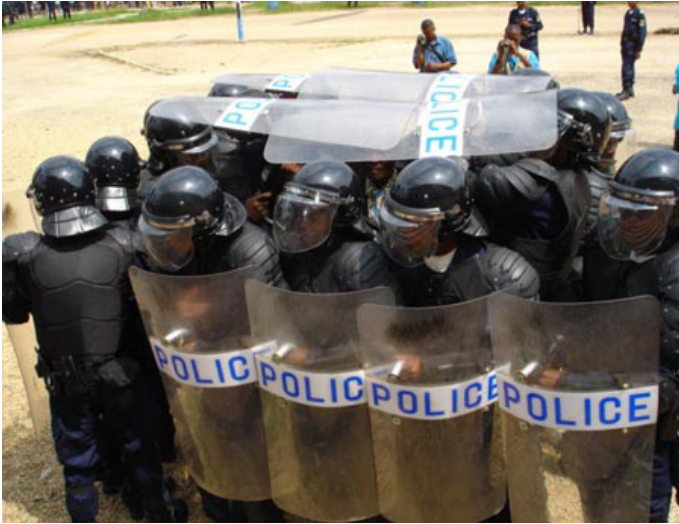
Von der MONUC ausgebildete Polizeikräfte während der Wahlen 2006 in der DRC.

schrauber auf relativ kleinem Raum und setzen die Verstärkungskräfte ab. Unverzüglich beziehen sie ihre im Voraus erkundeten Stellungen womit auch das Ende der Übung angezeigt ist. 24 Die Übungen sind u.a. notwendig, um den Umgang mit für Soldaten eher untypischen Einsatzmitteln wie Schildern (gegen Steinwürfe) zu trainieren. Die Schilder müssen beim Besteigen des Hubschraubers in einer bestimmten Weise getragen werden, damit sich der Luftzug der Rotoren nicht in ihnen verfängt. Das Foto der Woche in der Aprilausgabe der Zeitschrift „Y - das Magazin der Bundeswehr“ zeigt junge Männer in Armeehosen, die vor einem Panzer und deutschen Feldjägern wegstürmen, im Hintergrund ein Hubschrauber, folgender Text erläutert die Szene: „Das Operational Reserve Battalion trainiert seine Fähigkeiten im Kosovo bei der Übung ‚Balkan Hawk‘ und bekommt von den Amerikanern Unterstützung aus der Luft. Sie versuchen die Demo mit Hilfe eines Apache-Hubschraubers aufzulösen.“ Die Uniformen der Feldjäger tragen dabei keine Tarnflecken sondern sind in einheitlichem grün gehalten so wie (früher) die der deutschen Bereitschaftspolizei (denen sie verdächtig ähneln). Außerdem tragen sie offensichtlich Schienbeinschoner.