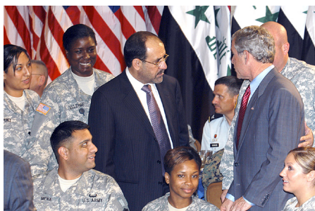
Premierminister al-Maliki und Bush