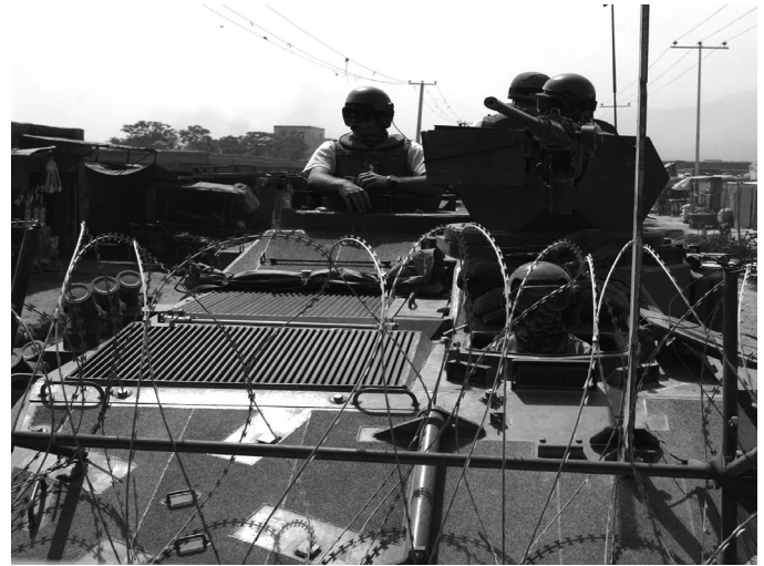
ISAF-Einsatz in Afghanistan