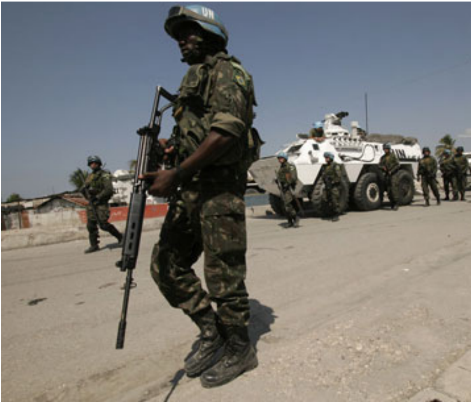
Razzia der MINUSTAH gegen Gangs im Armenviertel Cité Soleil der Hauptstadt Port-au-Prince im Februar 2007.

Bürgerkrieg aus? Eine wichtige Rolle spielen die „Interdiktion“, so Böckenförde, „also die Kontrolle und das Unterbrechen von Personen- und Güterverkehr“. 7 Dies soll einerseits die Verfügungsgewalt potentieller Gegner über Waffen und waffenfähiges Material einschränken, wie der UNIFIL-Einsatz im Libanon, andererseits den sicheren Transport sowohl von Rohstoffen als auch Exportprodukten gewährleisten und damit das wirtschaftliche Rückgrat der Ersten Welt stärken, was durch eine dauerhafte Präsenz der Marine an wichtigen Passagen der Weltmeere realisiert werden soll. 8