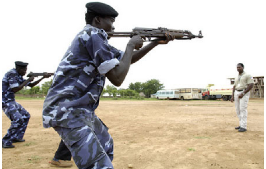
Polizeiausbildung im Rahmen des UNMIS-Einsatzes im Sudan

Zur intensiven militärischen und strategischen Zusammenarbeit kam es jedoch erst wieder 2006, nachdem der „Hohe Vertreter für die Gemeinsame Außen- und Sicherheitspolitik“ der EU, Javier Solana, gegenüber der UN Bereitschaft für ein erneutes Engagement in der DRC signalisierte und von der UN eine offizielle Anfrage an die EU erging. Die EU sollte und wollte während der Wahlen im Sommer eine eigene Mission nach Kinshasa entsenden, um erneut die dort bereits stationierte UN-Truppe MONUC bei der Absicherung der Wahlen zu unterstützen. Insbesondere der EU-Entwicklungskommissar Louis Michel, zuvor Außen- und Außenhandelsminister der ehemaligen Kolonialmacht am Kongo (Belgien), sowie Frankreich drängten auf diesen Einsatz. Deutschland erklärte sich bereit, die Führung der EUFOR DRC zu übernehmen, da es in dieser Region weni-