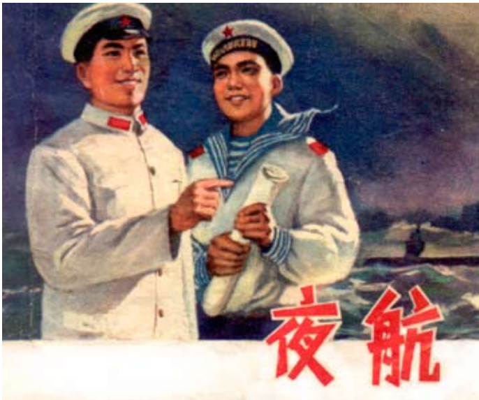
Adrett in Uniform - Selbstbild der chinesischen Streitkräfte, Comictitel aus den 70er Jahren: Nachtfahrt

Dem Wortlaut nach dienen alle diese Elemente dazu, dass Leben der Chinesen sicherer zu machen, sie bedeuten jedoch eine fortschreitende Zentralisierung militärischer Kräfte und die Verschlingung der Sicherheitsorgane auf effizientere Strukturen. Das dabei die polizeiliche Hoheit der Regionen ausgehöhlt und die Kontrolle der Bevölkerung perfektioniert wird, ist ein gewollter Umstand.