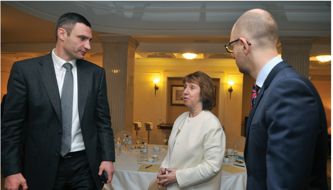
Die EU-Außenbeauftragte Catherine Ashton mit den (damaligen) ukrainischen Oppositionellen Witali Klitschko (Udar) und Arseniy Yatsenyuk (Batkivschtschina).