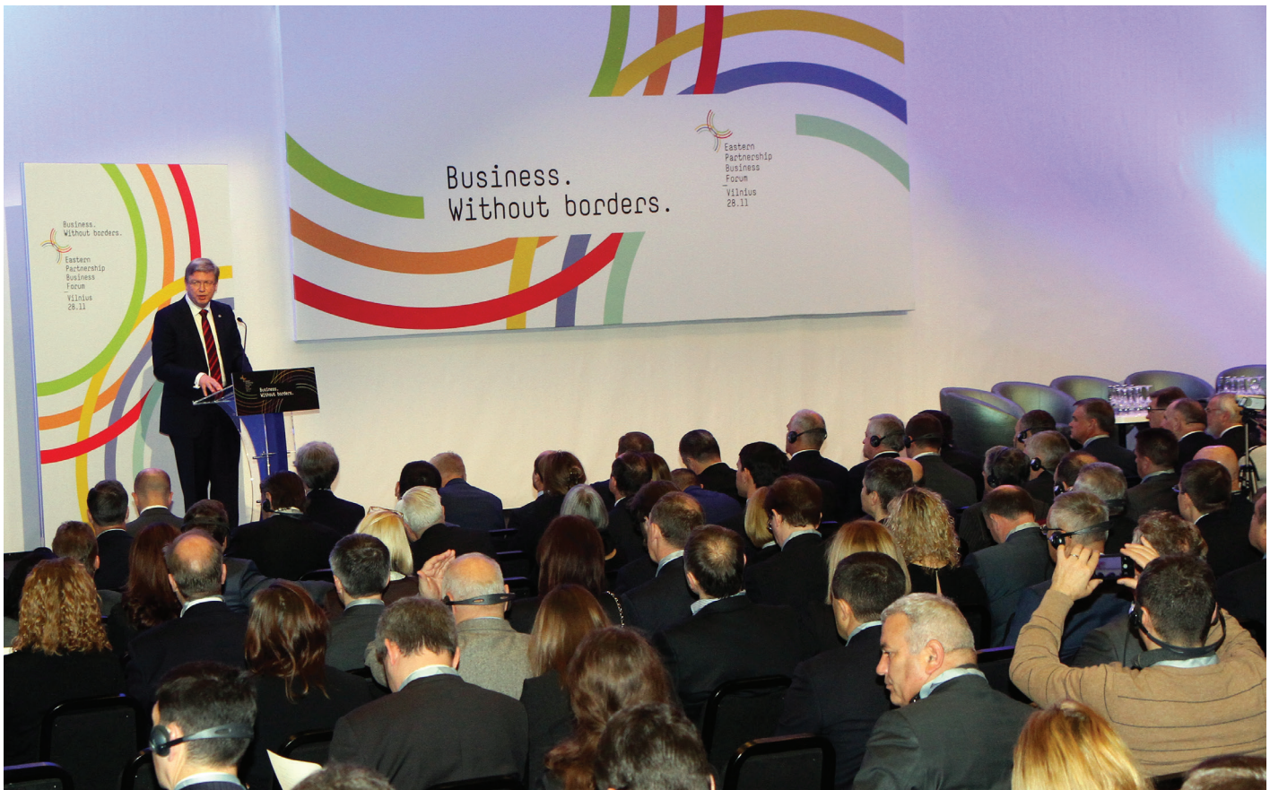
EU-Erweiterungskommissar Štefan Füle beim Gipfeltreffen der Östlichen Partnerschaft Ende November 2013.