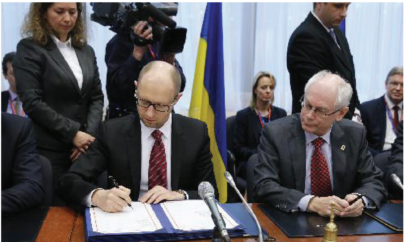
Unterzeichnung des Assoziationsabkommens zwischen der Ukraine und der EU Ende März 2014.