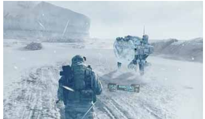
Mit modernster Technik in den Krieg: Drohen (links) und Warhound (rechts)