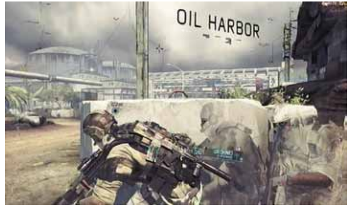
Mission „Noble Tempest“

Ghost: „Werden die zu uns auch so nett sein, Sir?“ - „Solange die Sie nicht sehen „, antwortet der Einsatzleiter. Die Ghosts schlagen sich daraufhin durch die Straßen und kämpfen gegen Einheiten des Waffenhändlers. Das Auto des Händlers entpuppt sich am Ende des Straßenkampfes als verlassen, dafür aber mit einer via Mobiltelefon zündbaren Bombe präpariert - das Ghost-Team kann der Explosion gerade noch entgehen und jagt dem Waffenhändler, der sein Fahrzeug gewechselt hat, nun mit Blackhawk-Hubschraubern einem Bergpass entlang. Derweil wurde der Händler identifiziert, es handelt sich um eine Russin namens Katja Prugowa, die eine Import-Export-Firma mit Kontakten zu „kriminellen Elementen“ betreiben soll. Nach einer wilden Verfolgungsjagd, bei der der Spieler mit einer Gatling-Gun vom Hubschrauber aus feindliche Militärfahrzeuge und sogar einen gegnerischen Hubschrauber zerstören muss, kann Prugowas Wagen gestoppt werden. Die Russin wird lebend von den Ghosts gefasst und gefangen genommen.