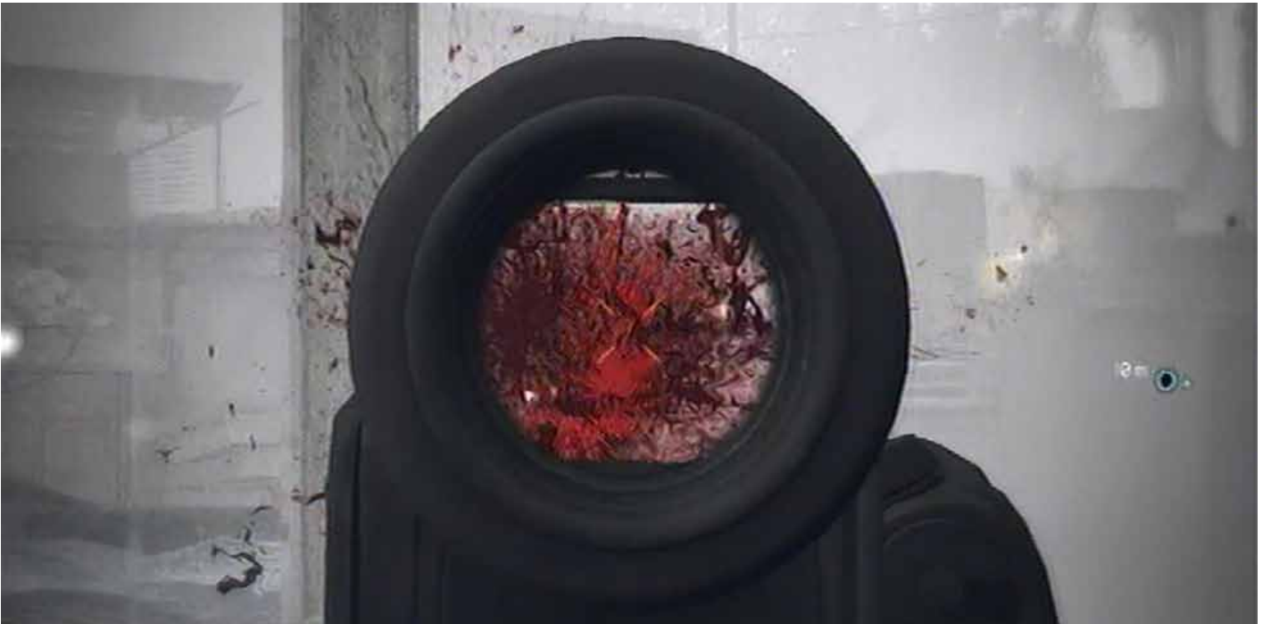
Das Blut muss spritzen ... Blick durch ein Zielfernrohr

Debatte in Deutschland oft nur um die Frage der dargestellten Gewalt. Was die Spiele für politische Aussagen verbreiten, spielt in der öffentlichen Diskussion im Gegensatz dazu kaum eine Rolle. Es wird über äußere Formen, nicht aber über den Inhalt der Videospiele diskutiert. 3 Dabei sind die in den Spielen erzählten Geschichten und Darstellungen oft hochbrisant. Daher folgt diese Studie meiner Vorherigen über den First-Person-Shooter „Battlefield 3“ 4 und soll „Ghost Recon - Future Soldier“ vor allem aus politikwissenschaftlicher Sicht kritisch reflektieren.