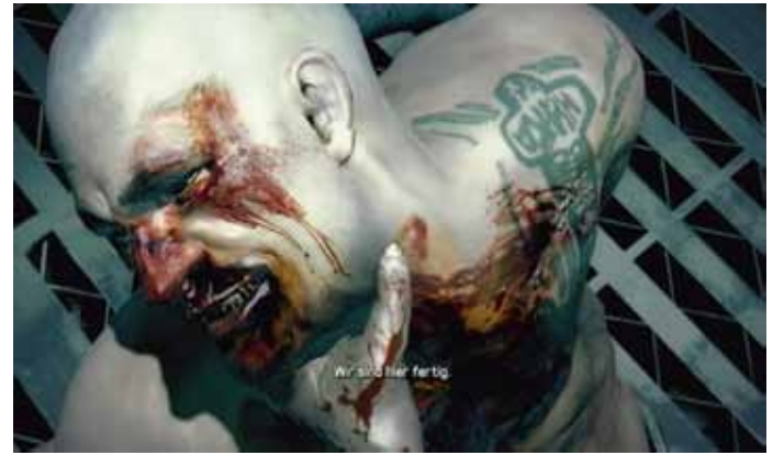
Mission „Valiant Hammer“

entlehnten Karte, wird eine Industrieanlage samt zweier erhöhter Terrassen, von deren das Schlachtfeld überblickt werden kann, zum Kriegsschauplatz.