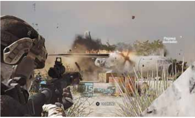
Mission „Subtle Arrow“