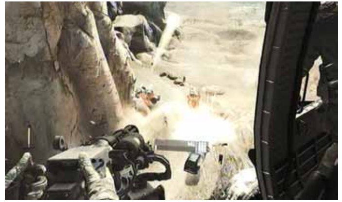
Gegen Waffenschmuggler in „Tiger Dust“, Foto: UbiSoft

töten und der Frau das Leben retten. Auch im Flüchtlingscamp werden Bewaffnete gezeigt, die Bewohner der Zeltstadt scheinbar grundlos schikanieren. Sie aufzuhalten ist zwar gerechtfertigt, die einzige Möglichkeit dafür ist jedoch, die Männer zu töten.