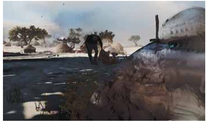
Mission „Subtle Arrow“

Militärkonvois sind getroffen. Ende der Szene. Als Nächstes sieht der Spieler mehrere mit Scharfschützengewehren im Gras liegende Ghost-Einheiten: „Legt an. Wir schalten sie zusammen aus.“ Der Spieler sieht die Soldaten des Konvois durch sein Zielfernrohr - er ist nun einer der Ghosts - einen Verletzten aus einem der Jeeps holen: „Ziele markiert. Fünf vier drei zwei eins.“ - eine Einblendung zeigt dem Spieler welche Taste er zur Abgabe eines Schusses drücken muss. Der Schuss sitzt und die US-Soldaten stürmen danach zum Konvoi. Die letzten überlebenden Feinde werden mit Rauchgranaten irritiert, der Spieler kann mit seinem Nachtsichtgerät durch den dichten Rauch gucken, die Gegner anvisieren und feuern. Nach einem kurzen Feuergefecht sind alle Gegner getötet und in einer Skript-Sequenz - einem Zwischenvideo - durchsucht einer der Ghosts einen Lastwagen. Er findet einige Sprengköpfe und übermittelt dies über Funk an die Kommandozentrale als plötzlich ein Mobiltelefon beginnt zu klingeln: „Was zum „, sagt der Ghost noch bevor die Zentrale ihn auffordert sofort zu fliehen - die Ghost-Einheit ist auf eine fernzündbare Bombe gestoßen. Erst einige Meter vom Lastwagen entfernt explodiert die Bombe und die fliehenden US-Soldaten werden durch die Luft geschleudert. Die Figur des Spielers kann sich noch an einem Abhang festhalten, doch glühender weißer Phosphor brennt sich in seine Arme, bis er sich nicht mehr halten kann und in eine Schlucht stürzt.