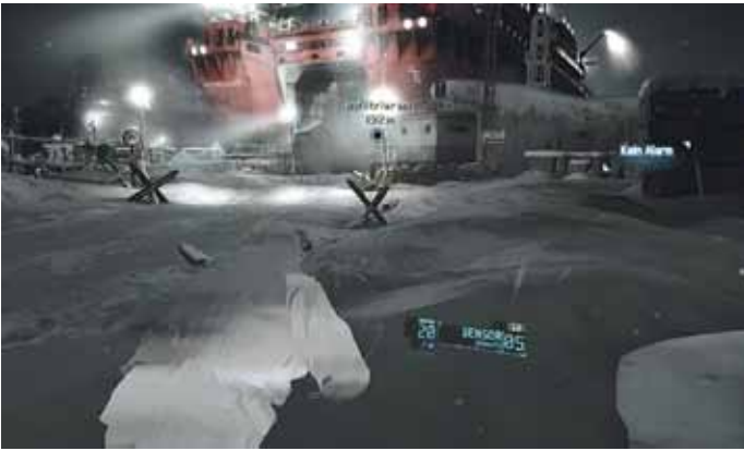
Keine Kreuzfahrt, Mission „Deep Fire“, Foto: UbiSoft