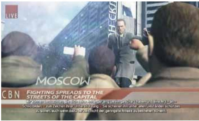
Liveeinblendung bei „Invisible War“