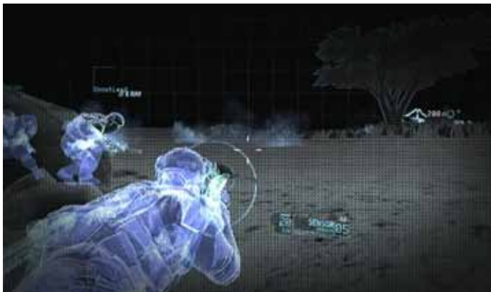
Röntgenblick, Foto: UbiSoft