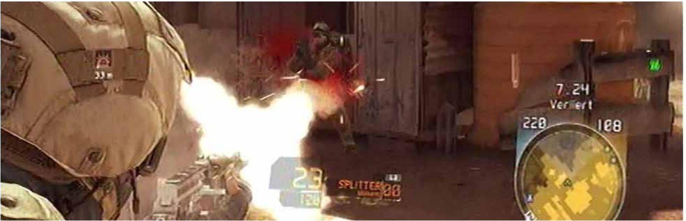
Im Multiplayer-Modus auch gegen Zivilisten?, Foto: UbiSoft

ist aber schlicht falsch. Es ist möglich im Spiel ungestraft Zivilisten zu töten und ob auch die Gewalt gegen die dargestellten Feinde sinnvoll ist, darf zumindest kritisch hinterfragt werden.