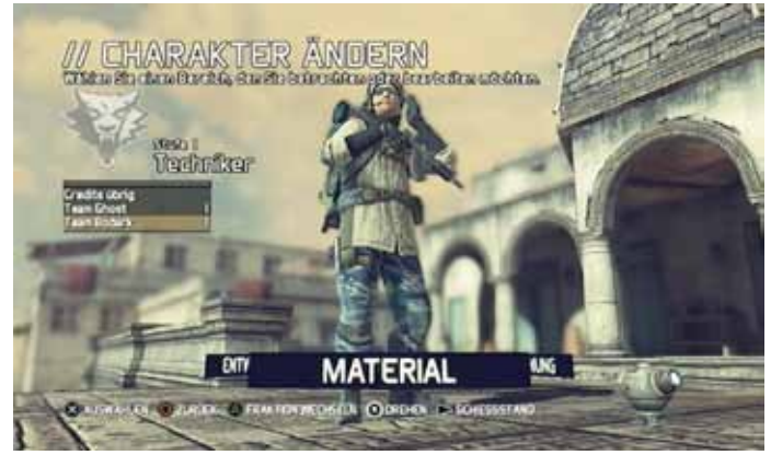
Heldenbaukasten, Foto: UbiSoft

stens mithilfe von Drohnen durchgeführten, verdeckten US-Militäroperationen sind nicht im Einklang mit den Bestimmungen des Völkerrechts. Es ist schlichtweg verboten, mit irgendwelchen Spezialeinheiten wild in fremden Ländern herumzuoperieren - und das mit gutem Grund.