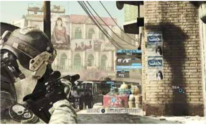
In den Straßen von Peshawar, „Tiger Dust“, Foto: UbiSoft