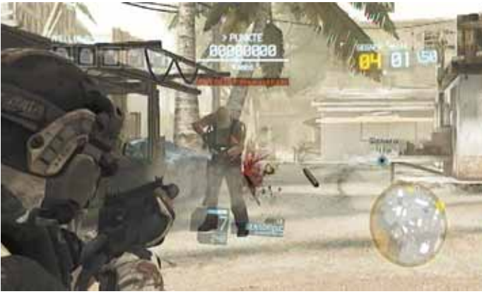
Üben um zum Held zu werden: Guerrilla-Modus