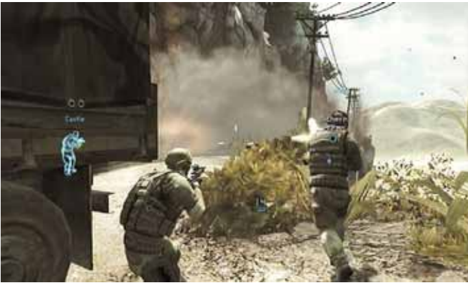
Mission Nicaragua: Boswa Biosphärenreservat