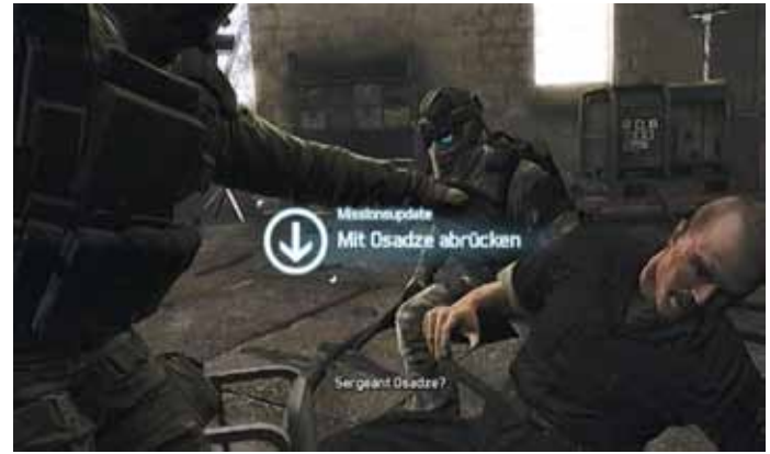
Geretteter Partner in „Ember Hunt“, Foto: UbiSoft