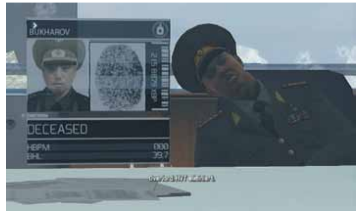
Toter Feind in „Invisible War“, Foto: UbiSoft

Sowjetunion eintreten. Diese Gruppe scheint allerdings momentan nicht dazu fähig, sich an die Macht zu putschen. Auch von Unruhen innerhalb des russischen Militärs ist nichts zu hören - dabei wäre ein realer Putsch in Russland ohne den Rückhalt des Militärs wohl kaum möglich und auch in „Ghost Recon - Future Soldier“ ist das Militär maßgeblich am Putsch beteiligt. Oder sind es möglicherweise schon der amtierende russische Präsident Vladimir Putin und seine Regierung, die eigentlich mit dem Feindbild im neuen „Ghost Recon“ gemeint sind?