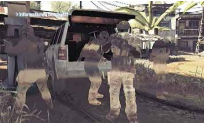
Informationsbeschaffung im Nigeria, „Noble Tempest“