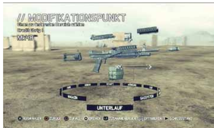
Verbesserungen an Waffen selbst gestalten, Foto: UbiSoft

pistole außer Gefecht und anschließend gehackt werden. Ist das Computersystem geknackt, werden die Positionen der feindlichen Kämpfer auf der Karte angezeigt.