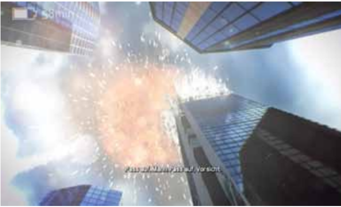
Großer Knall über London „Ember Hunt“, Foto: UbiSoft