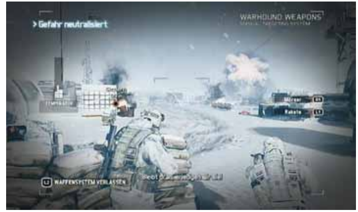
Mission „Silent Talon“

„ Deep Fire “, Barentsee, Westlich des Shtokman-Ölfeldes: „Raven's Rock“ ist aus dem Schatten getreten und hat in Moskau die Regierung übernommen. Zwei Drahtzieher konnten ausgemacht werden: General Bukharov leitet den militärischen Arm der Gruppe, Sergey Makhmudov ist der neue russische Präsident. Zwar gebe es, wie es in der Einsatzbesprechung heißt, noch einige Widerstandsgruppen, doch diesen gehe der Treibstoff langsam aus. In der Nordsee vor Norwegen sollen die Ghosts zwei Bohrschiffe finden und für die Widerstandsgruppen nutzbar machen: „Russland dürstet schon lange nach Öl - Nigeria ergibt jetzt viel mehr Sinn“, heißt es dazu in der Einsatzbesprechung (was mit Blick auf die Realität, in der Russland über riesige Energieressourcen verfügt, irritiert).