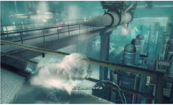
Große Raketen in Russland, „Silent Talon“